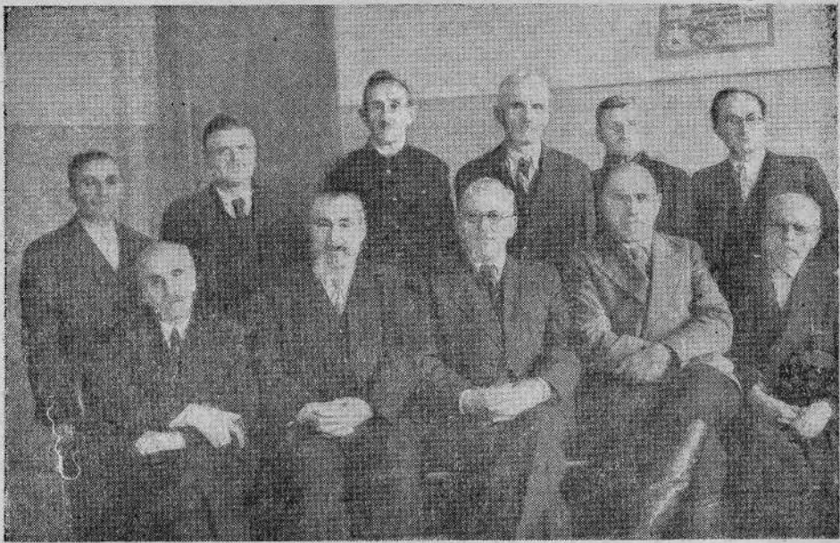
Группа работников ВСЕХБ на Украине