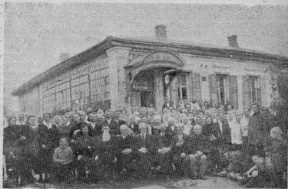
Молитвенный дом Полтавской общины (УССР)