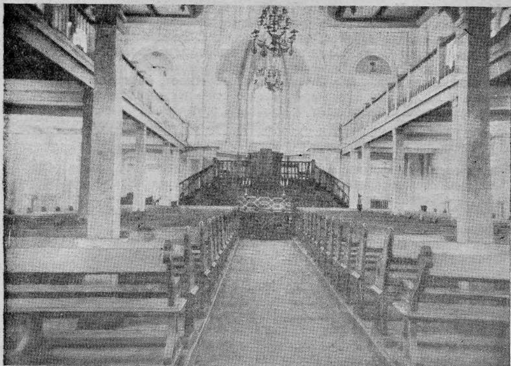
Зал Дома Евангелия в Москве

братьях. Пусть торжество братского общения всегда сопровождается плодами нашего служения Господу.