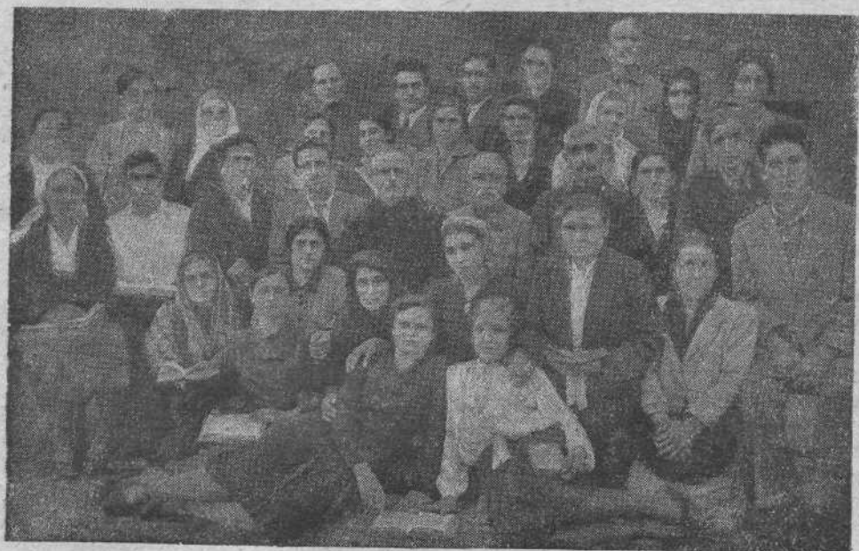
Ленинканская община (Армянск. ССР)

Оканчиваю словами: «Счастливого вам всем Рождества!»