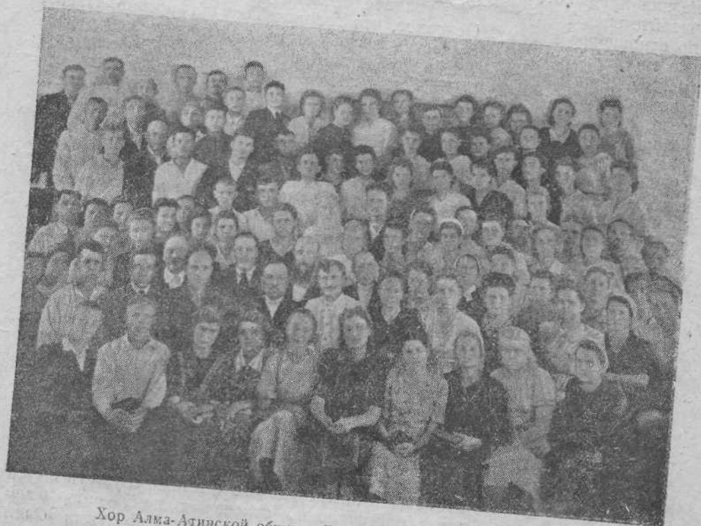
Хор Алма-Атинской общины Евангельских христиан-баптистов