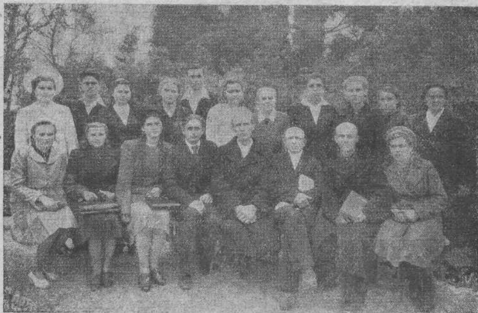
Хор Ялтинской общины