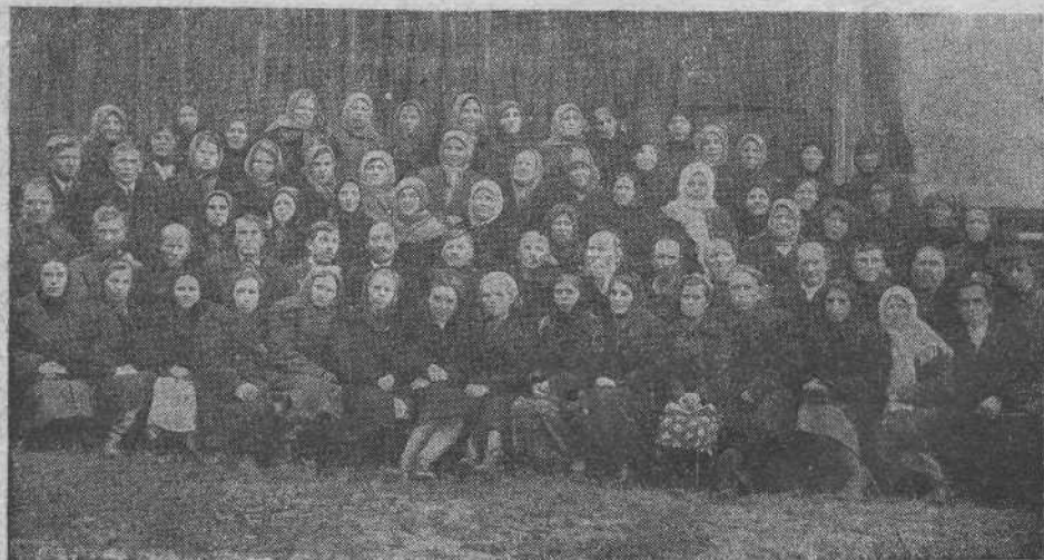
Кулебакская община (Горьков. области)