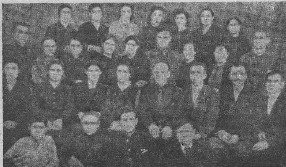
Хор Пензенской общины Евангельских христиан-баптистов

Ко всему сказанному мне остается прибавить только одно — посоветовать вам испытать этот способ. Не думайте, что одно знание способа уже обеспечивает за вами и результаты его применения. Это было бы похоже на то, как если бы кто-нибудь считал возможным утолить голод поваренною книгою. Но, думаю, могу обещать вам успех в том случае, если вы изберете описанный здесь простой и естественный путь. Время, проводившееся вами до сих пор во вздохах по плодам, употребите на выполнение условий их роста, и плоды несомненно явятся. Мы привыкли обращать все свое внимание на следствия, на самые состояния, свойственные истинной христианской жизни; мы их описывали, прославляли, советовали, молились о них, — словом, делали все, кроме одного — мы не старались отыскать причины, обуславливающие желанные действия. Займемся же теперь причинами. Все другие способы жить христианскою жизнью неверны, все иные пути к приобретению христианского опыта подлежат большому сомнению. Этот же способ, как естественный, не может обмануть наших ожиданий. Порукою в том законы природы, а они даны Самим Богом.