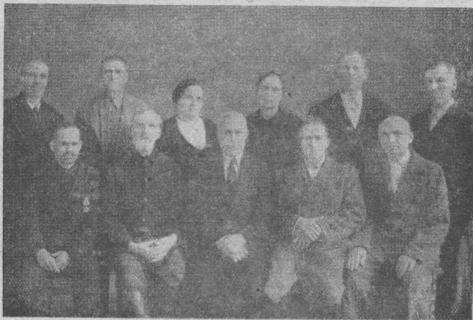
Работники Ессентукской общины

Так ли это? Если не так, то я желаю, чтобы мы, верующие, наполнились такою радостью.