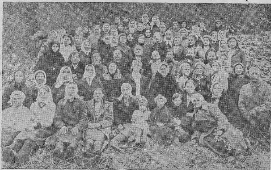
Севская община евангельских христиан-баптистов (Брянской обл.)

Да наполнит Господь каждого из нас обилием этой чудной любви и тогда мы будем жить ею, дышать ею, благоухать ею. Аминь.