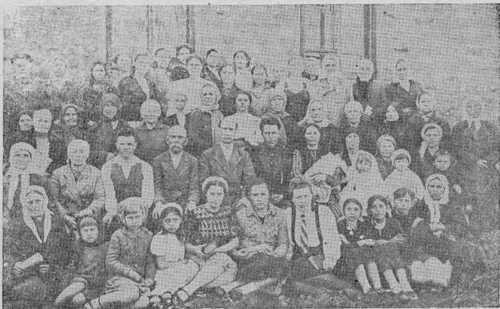
Лисичанская община (Ворошиловградской обл. УССР)