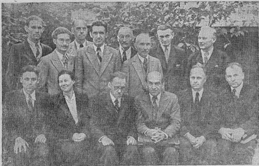
Группа работников Рижских церквей

в голгофских страданиях и смерти Иисуса Христа за грешников. Если и после этого не открывается сердце человека для Господа, тогда Господь применяет ключ железный — допускает испытания и скорби. Случается, что только в испытании человек уразумевает намерение Божие и скажет вместе с Давидом: «Благо мне, что я пострадал, дабы научиться уставам Твоим» (Псал. 118, 71). После этого сестра предложила присутствующим помолиться за меня.