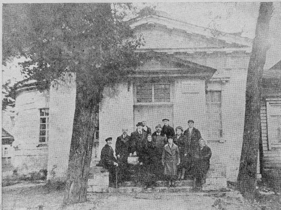
Молитвенный дом в г. Калининне

Калининская община евангельских христиан-баптистов 6 октября с. г. в торжественной обстановке праздновала открытие своего молитвенного дома. С вторжением немцев во время оккупации культовое по-