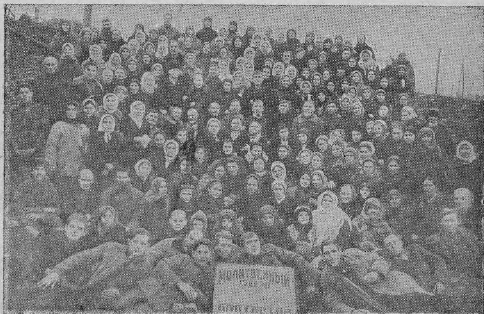
Воронежская община евангельских-христиан баптистов