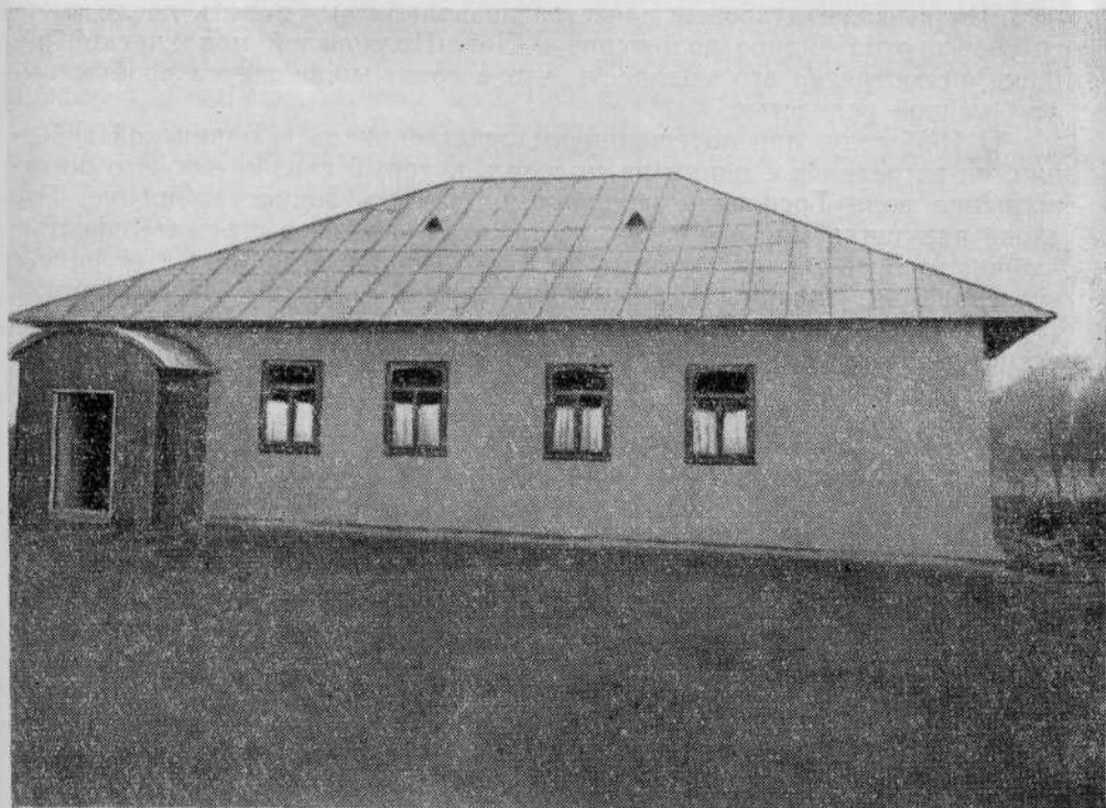
Молитвенный дом общины евангельских христиан-баптистов села Коржеуцы, Молдавской ССР