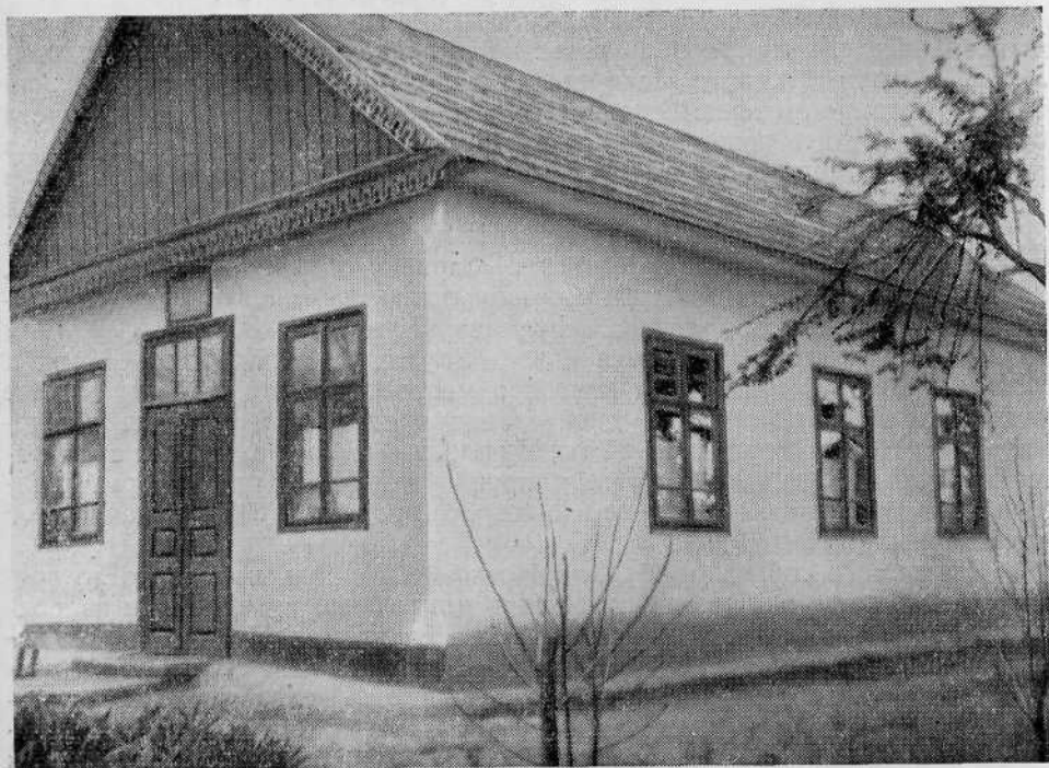
Молитвенный дом общины евангельских христиан-баптистов села Суворовка, Молдавской ССР.