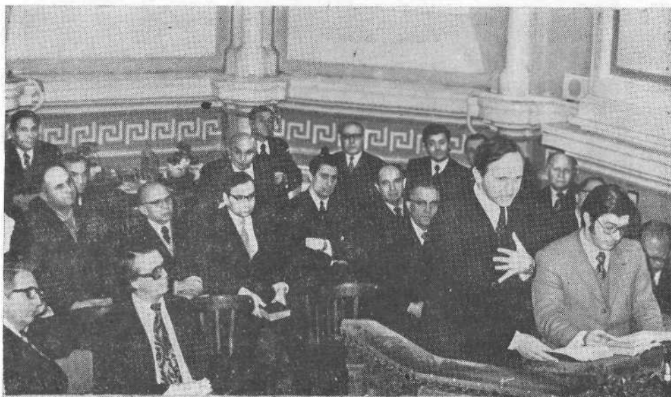
Представители церквей Швеции на богослужении Московской церкви.