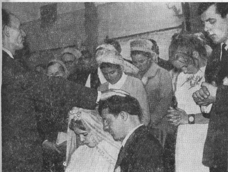
Бракосочетание в Новосибирской церкви

ответил: «Кто хочет... быть первым, да будет»... слугою (Матф. 20, 27).