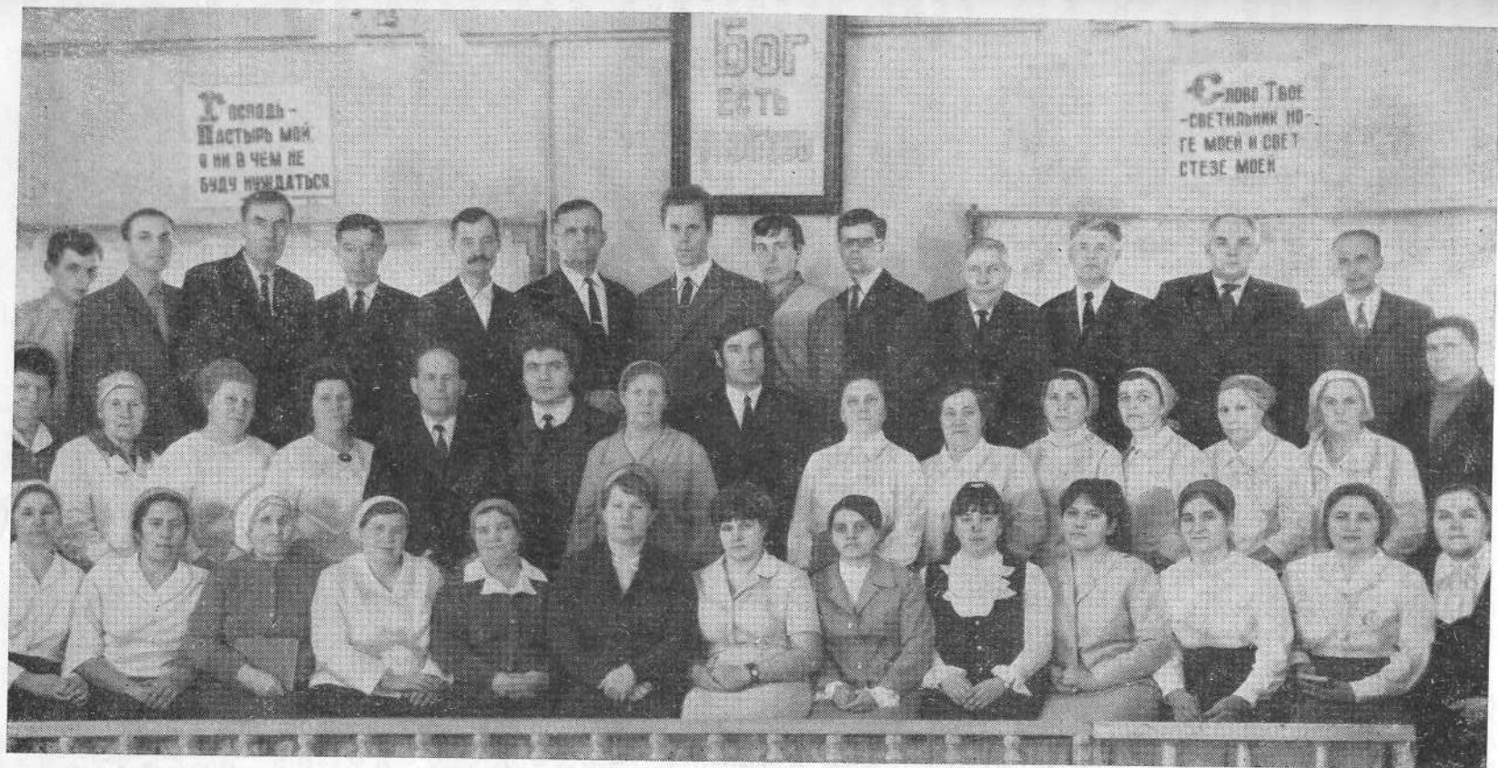
Хористы Хабаровской церкви