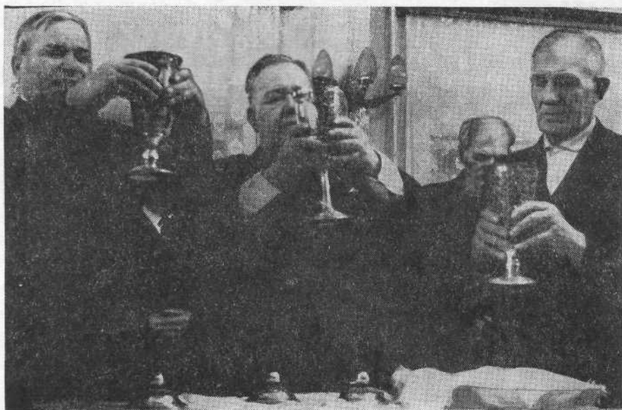
Вечеря Господня в Иркутской церкви