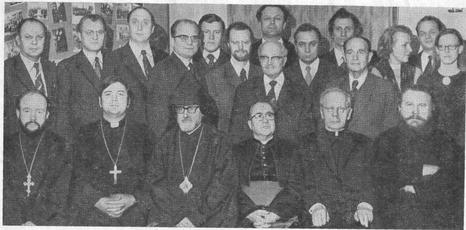
Представители различных христианских церквей среди сотрудников ВСЕХБ