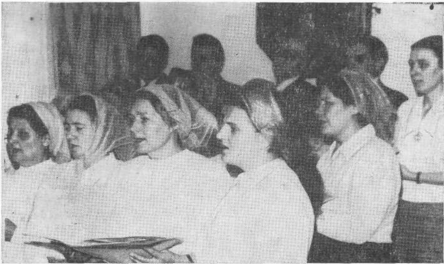
Хор церкви г. Кубинка.

г. Минеральные Воды. Поместная церковь отметила свое 80-летие.