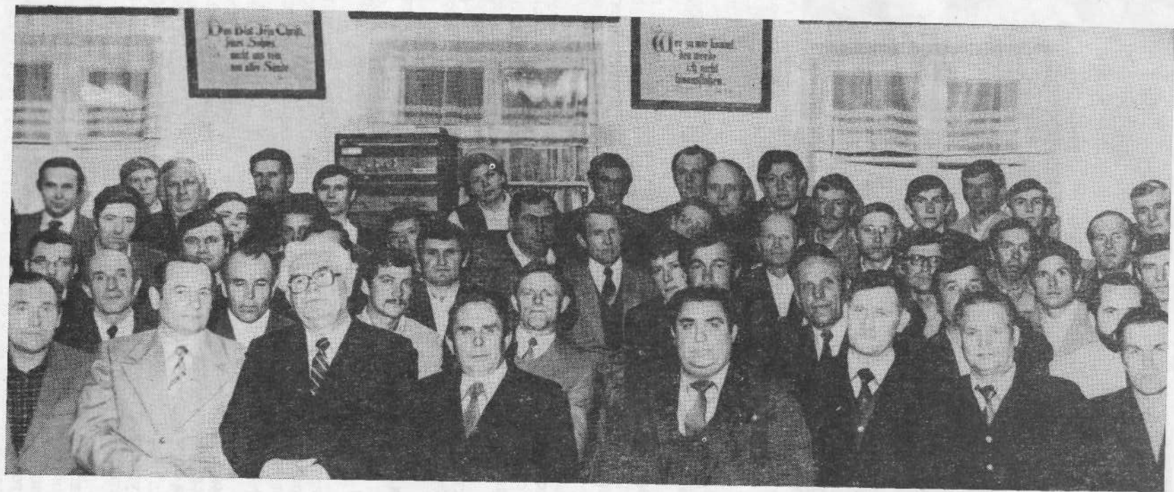
Представители ВСЕХБ среди членов церкви г. Рот-Фронт.