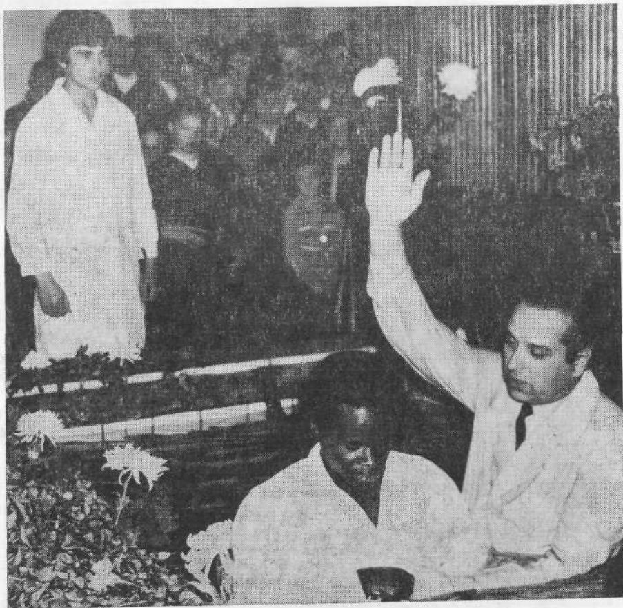
Крещение в церкви города Фрунзе.

Гости посетили ряд церквей и везде они выступали со словом назидания. Молитвенные дома были переполнены верующими не только в воскресные дни, но и в будние.