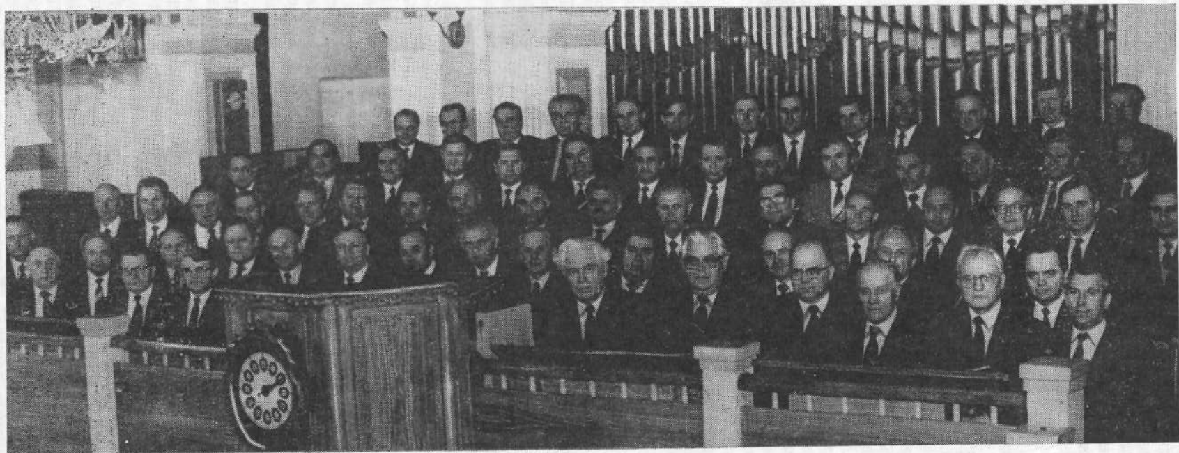
Участники Пленума ВСЕХБ.