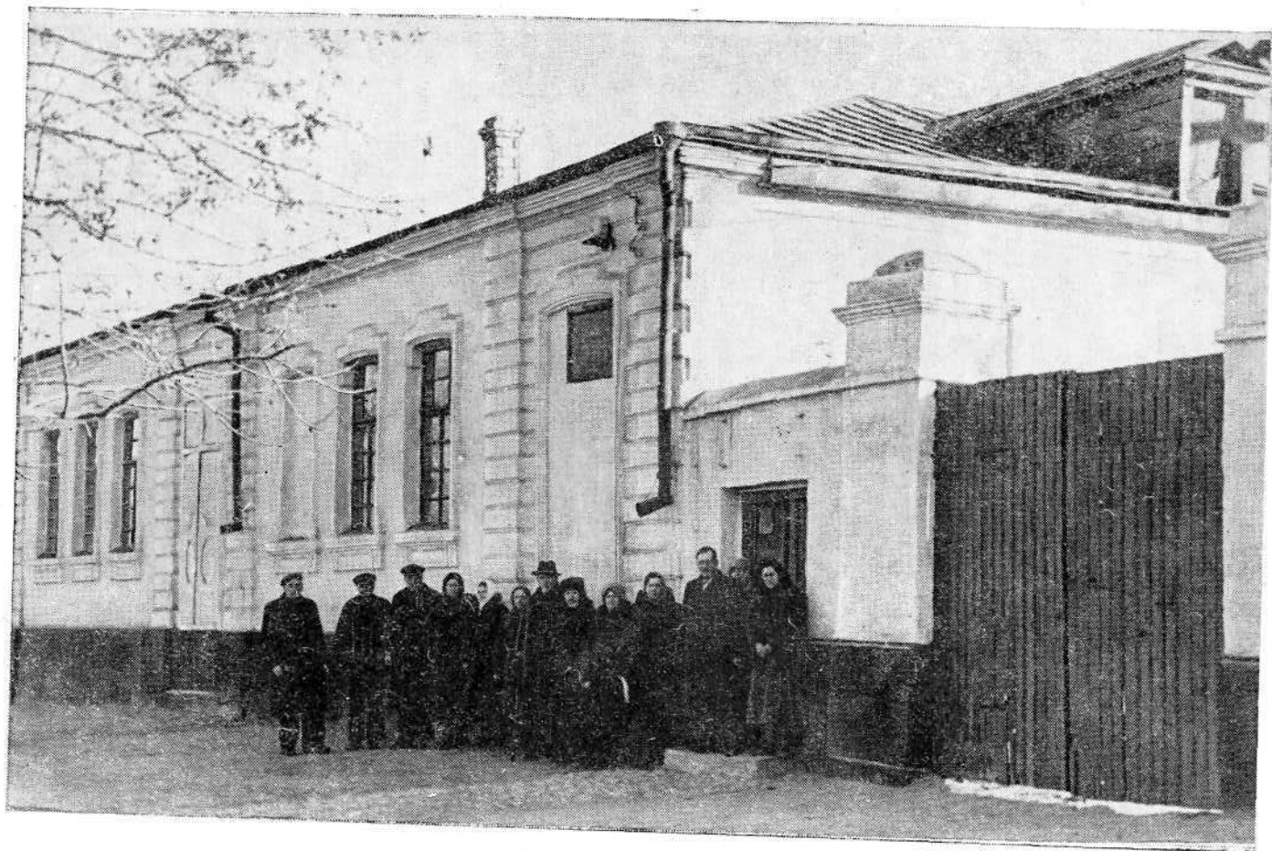
Молитвенный дом Николаевской общины евангельских христиан-баптистов