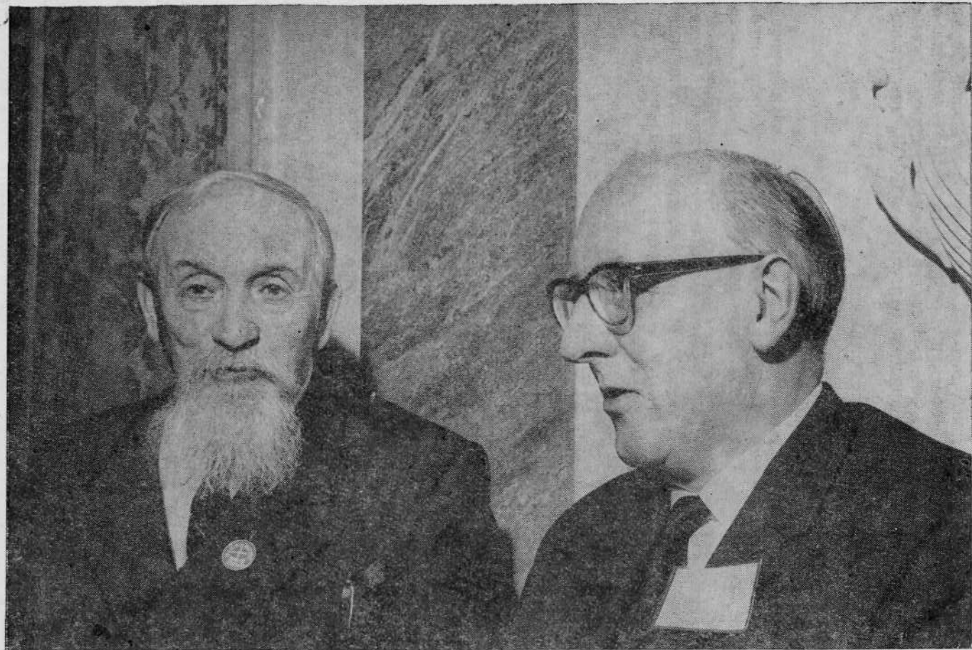
Председатель ВСЕХБ Я. И. Жидков и Генеральный секретарь Союза баптистов Великобритании д-р Эрнст Пейн на заседании Центрального Комитета Всемирного Совета Церквей в Париже