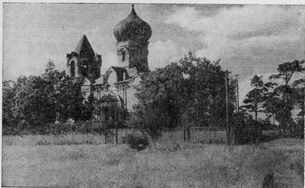
Молитвенный дом общины евангельских христиан-баптистов в Ленинграде