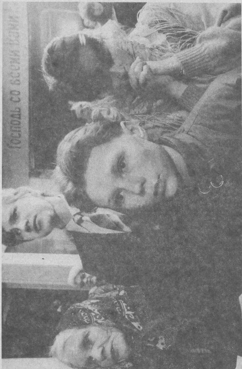
Верующие слушают выступление Джони Эрикссон