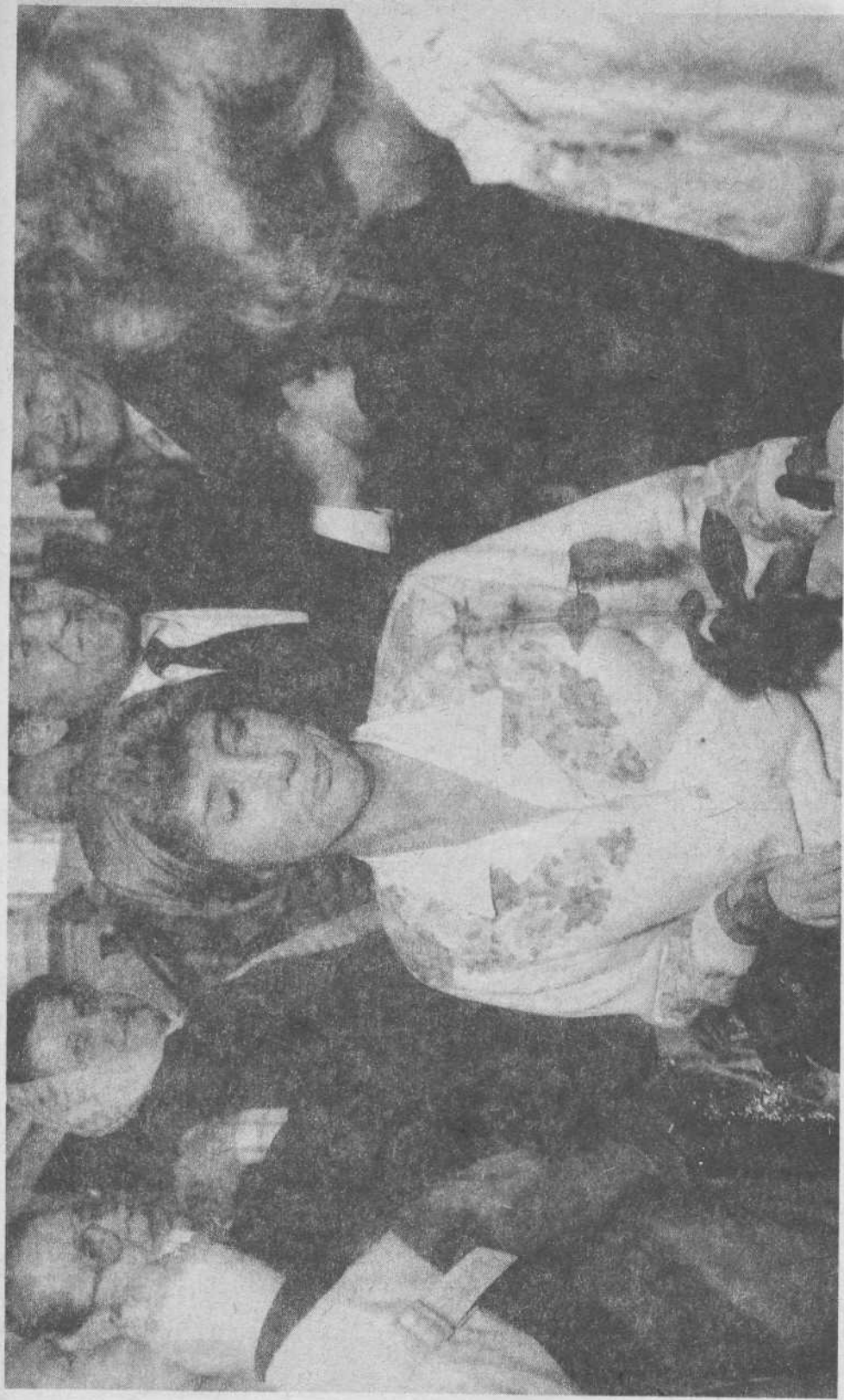
Верующие Московской церкви приветствуют Джони Эриксона