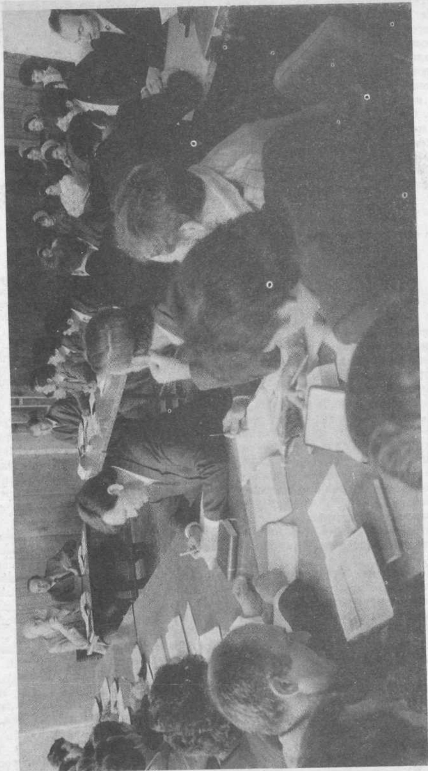
Занятия в Библейском институте