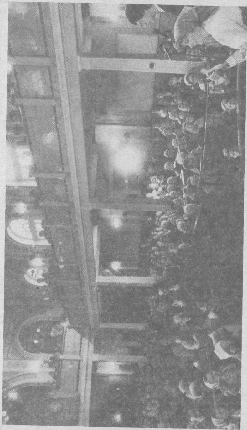
Богослужение в Московской церкви с участием Джони Эрикссон