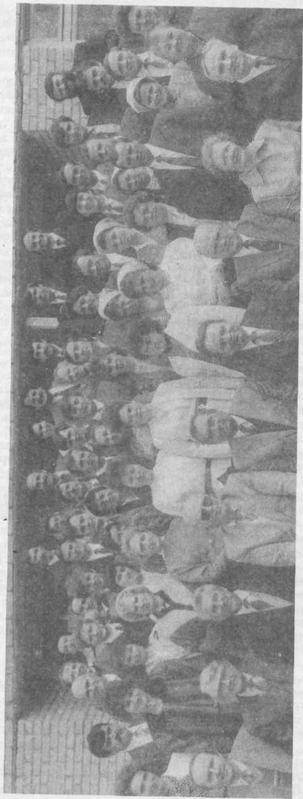
Руководящие братья и преподаватели среди выпускников Библейского института