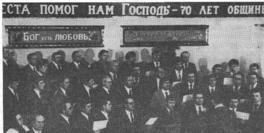
Хор церкви города Винницы.