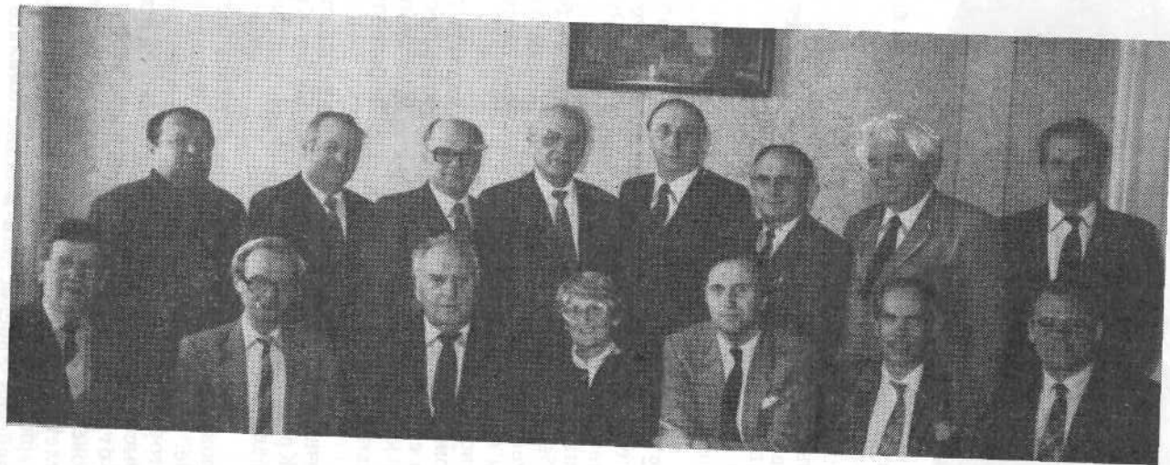
Гости из Швеции в канцелярии ВСЕХБ.