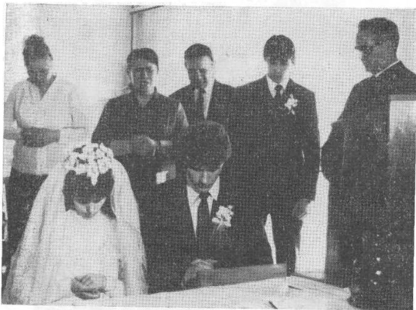
Бракосочетание в Краснодарской церкви.

с. Бородино, ст. Чернянка. Здесь также совершено водное крещение. Дети Божии горячо благодарили Господа за спасение и дар вечной жизни.