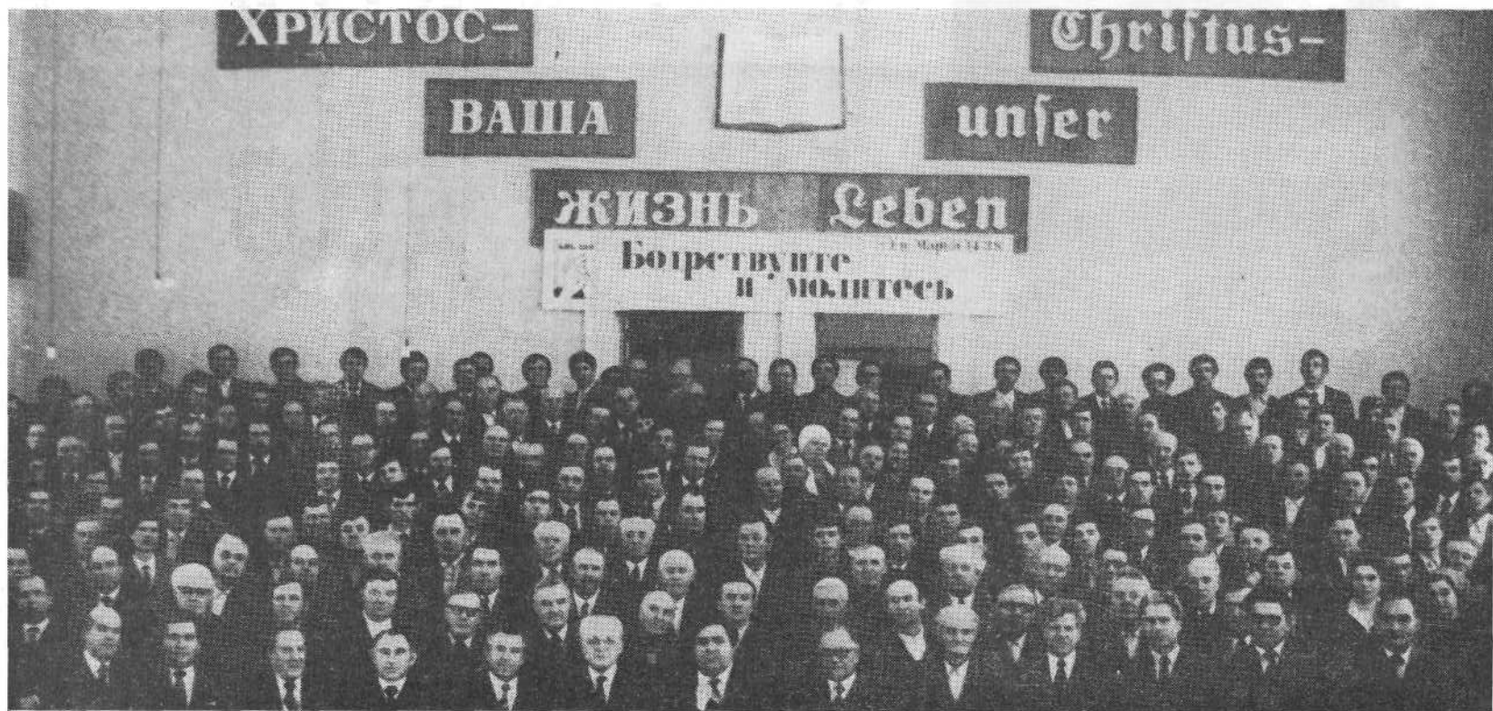
Участники совещания служителей церквей Казахстана.