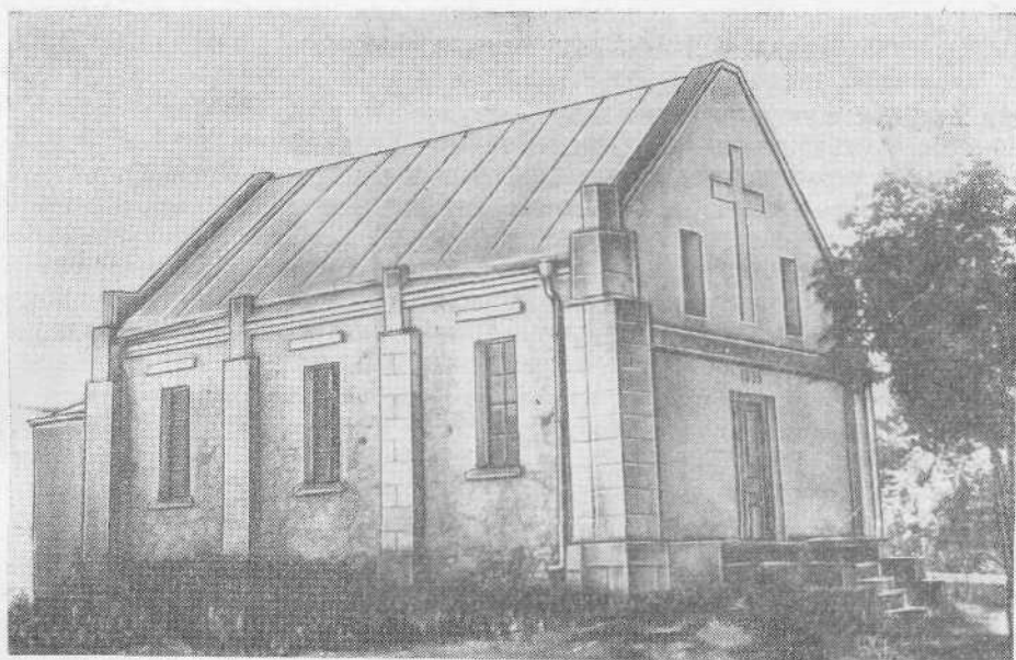
Молитвенный дом общины евангельских христиан-баптистов с. Кобиля (Тернопольская область)