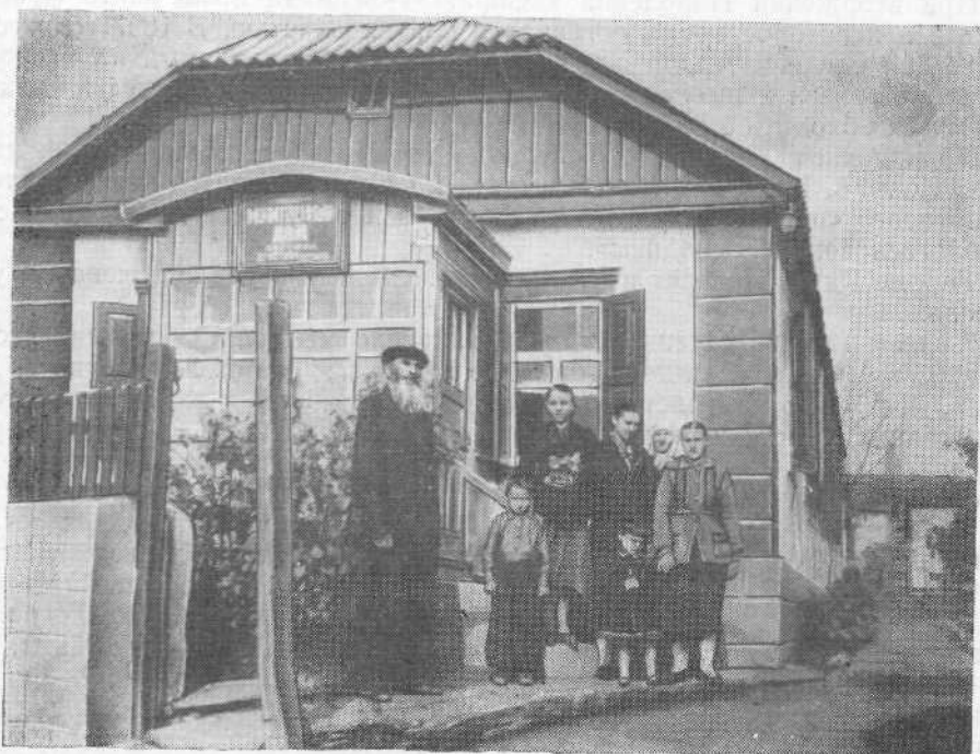
Молитвенный дом общины евангельских христиан-баптистов г. Ровеньки (Луганская область)