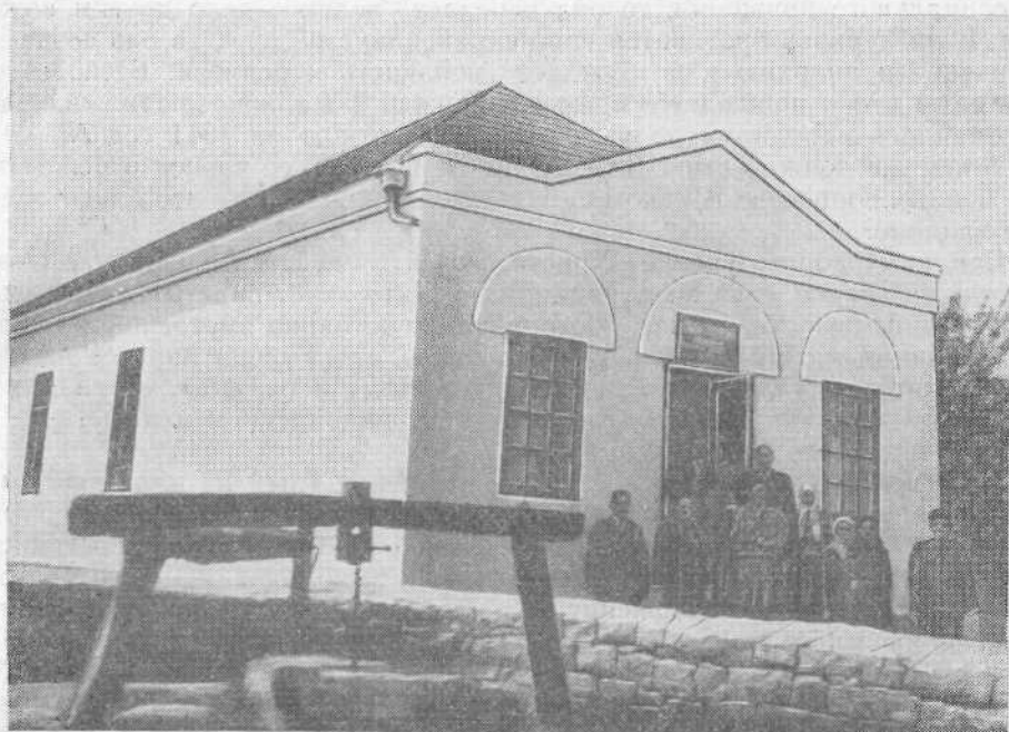
Молитвенный дом общины евангельских христиан-баптистов с. Каларашовки (Молдавская ССР)