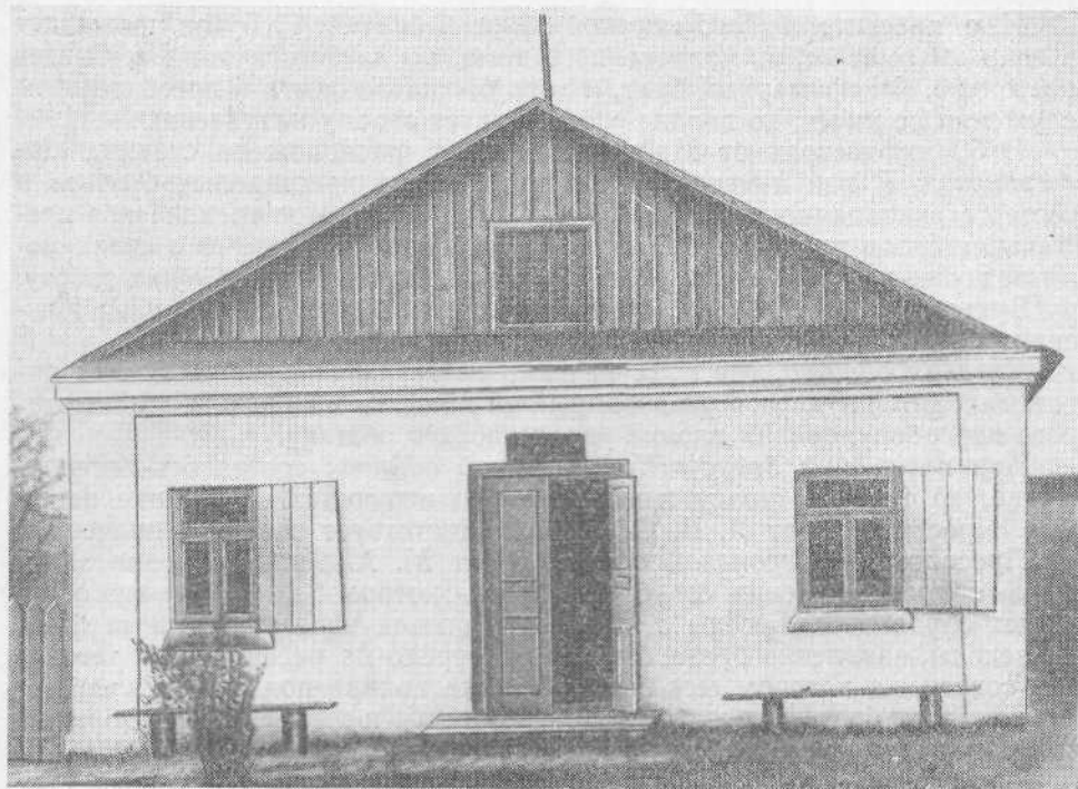
Молитвенный дом общины евангельских христиан-баптистов г. Кобрина (Белорусской ССР)