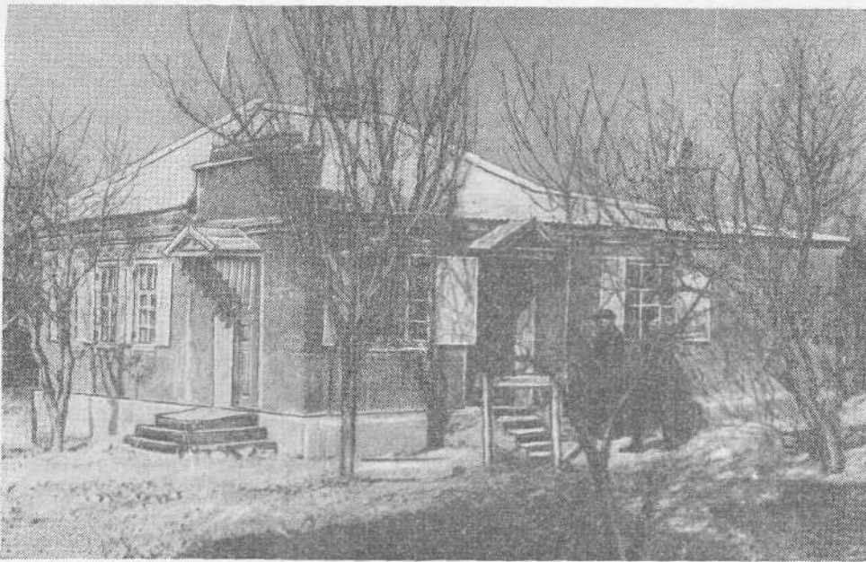
Молитвенный дом общины евангельских христиан-баптистов станции Крымской (Краснодарский край)

Что Христос здесь на земле был в подобии плоти: Иоан. 1, 14; Филипп. 2, 7; Евр. 5, 7.