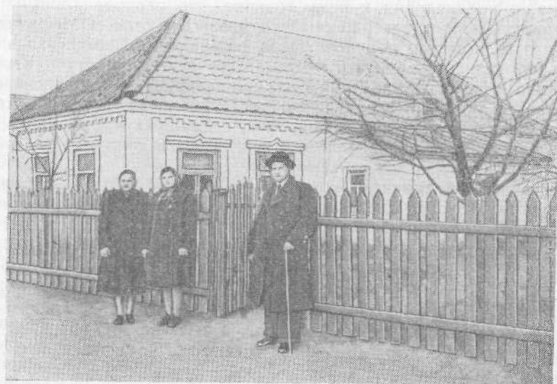
Молитвенный дом общины евангельских христиан-баптистов г. Нико- поля (Днепропетровская область)