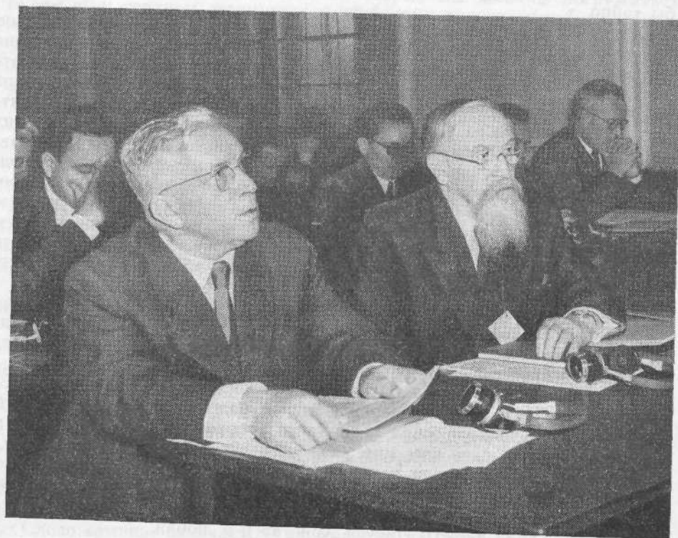
На 2-й Христианской Конференции мира в Праге (Чехословакия)