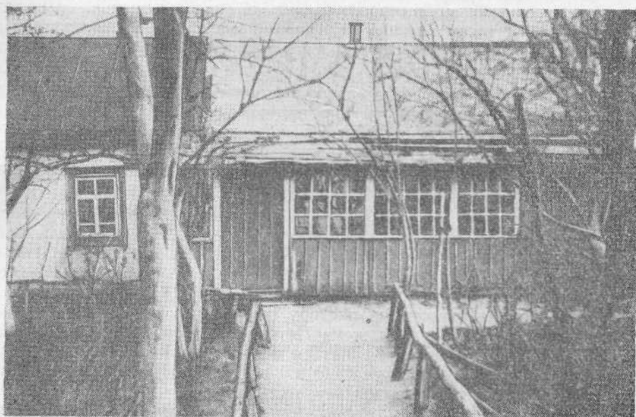
Молитвенный дом общины евангельских христиан-баптистов с. Боровое (Киевская область)