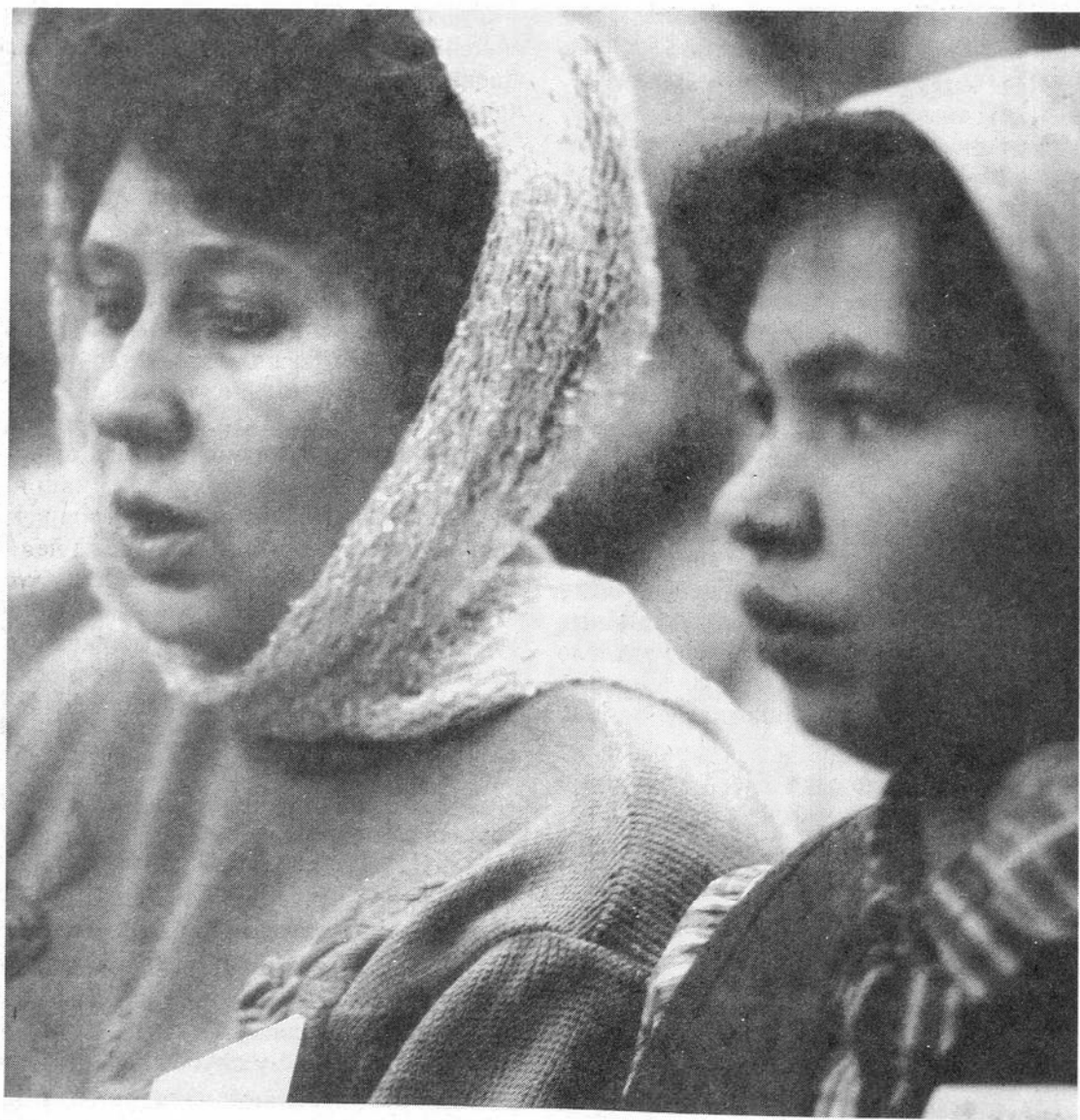
Участницы женской конференции

человека мы слушаем больше, чем голос Божий. Тогда Господу приходится нас ломать, чтобы сделать из нас благоугодный сосуд. А это бывает тяжело.