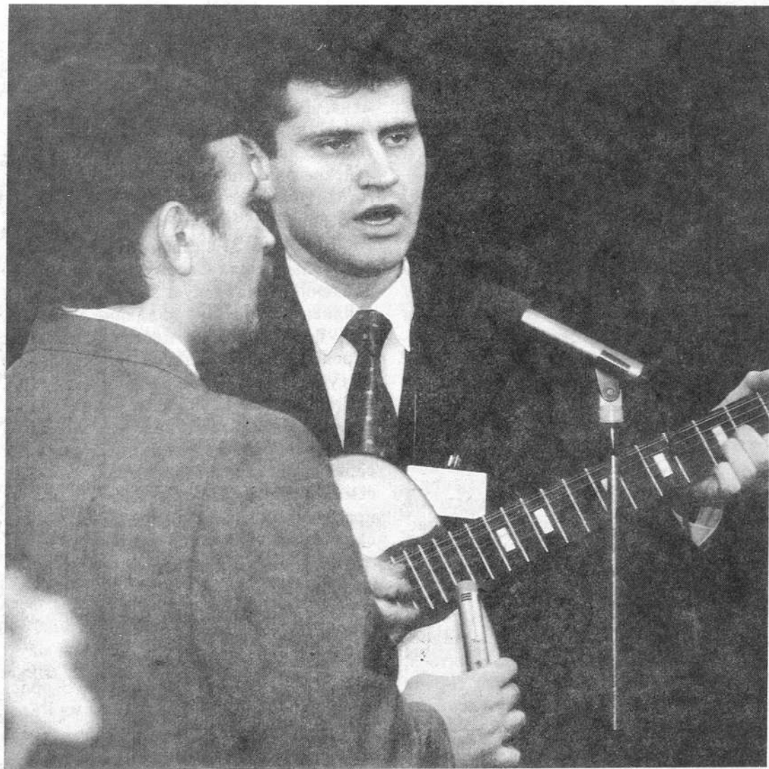
Братья приветствуют участниц конференции исполнением духовных песнопений

Утренняя молитва есть практический шаг для жизни в святости в течение дня. Мы должны очень трепетно, в послушании ходить пред Богом. Наше личное хождение перед Ним очень важно. Этому нужно учить сестер.