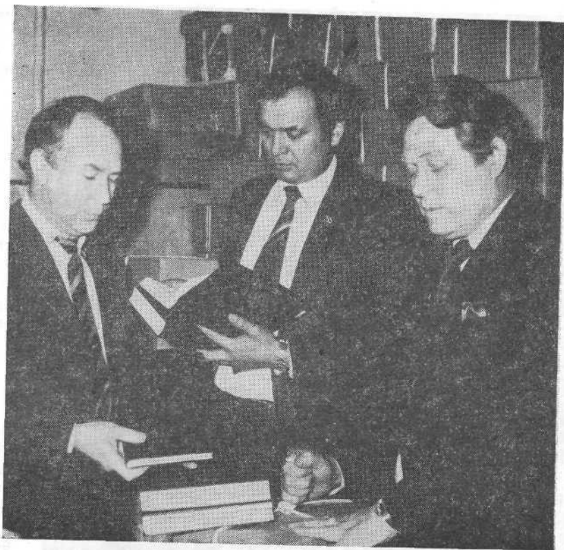
Получение во ВСЕХБ Библий нового выпуска.

обрадую их в Моем доме молитвы... ибо дом Мой назовется домом молитвы». Господь, — продолжал брат, — собрал нас сегодня на святую гору, в церковь Божию, которая выше всех гор и высот духовных. Сердца наши преисполнены радостью и благодарностью Господу за Его дивную и безграничную любовь к детям Своим.