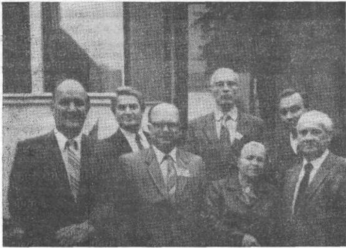
Участники Международной конференции в Венгрии.

поведями, имели встречи со служителями, во время которых рассказывали о жизни и деятельности Южной баптистской конвенции.