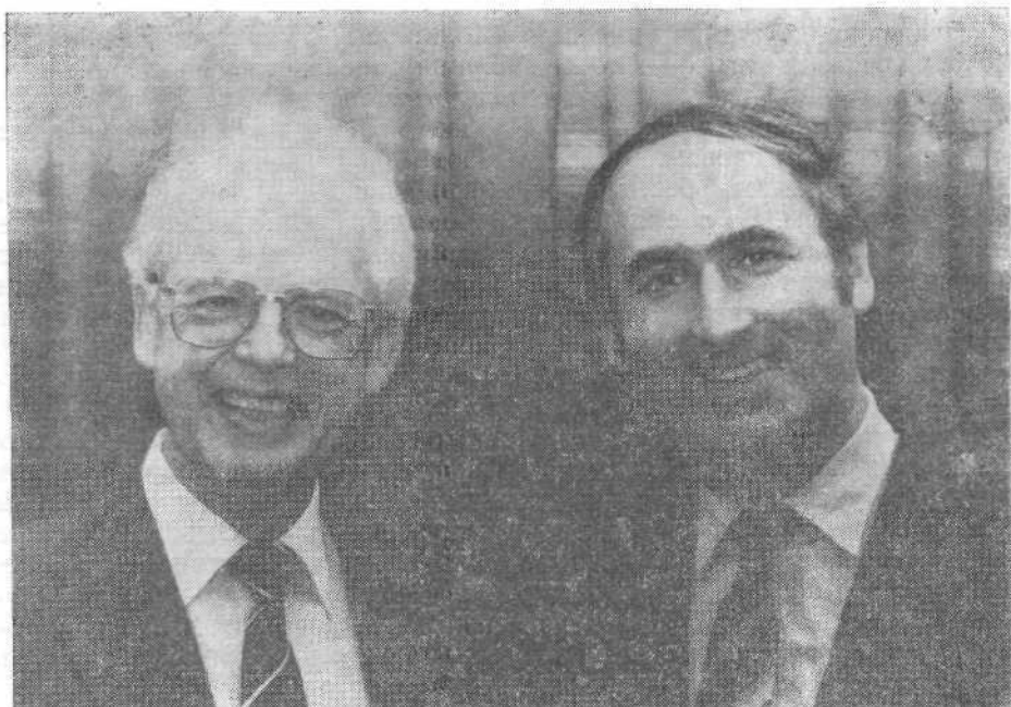
Генеральный секретарь Европейской баптистской федерации К. Вумпельман с новым генеральным секретарем Союза баптистов Чехословакии Я. Поспишиллом.

какие произвел Он опустошения на земле: прекращая брани до края земли, сокрушил лук и переломил копье, колесницы сжег огнем. Остановитесь и познайте, что Я Бог: буду превознесен в народах, превознесен на земле. Господь сил с нами, заступник наш Бог Иакова».