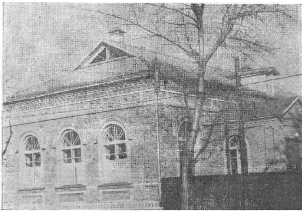
Молитвенный дом церкви города Кировограда.