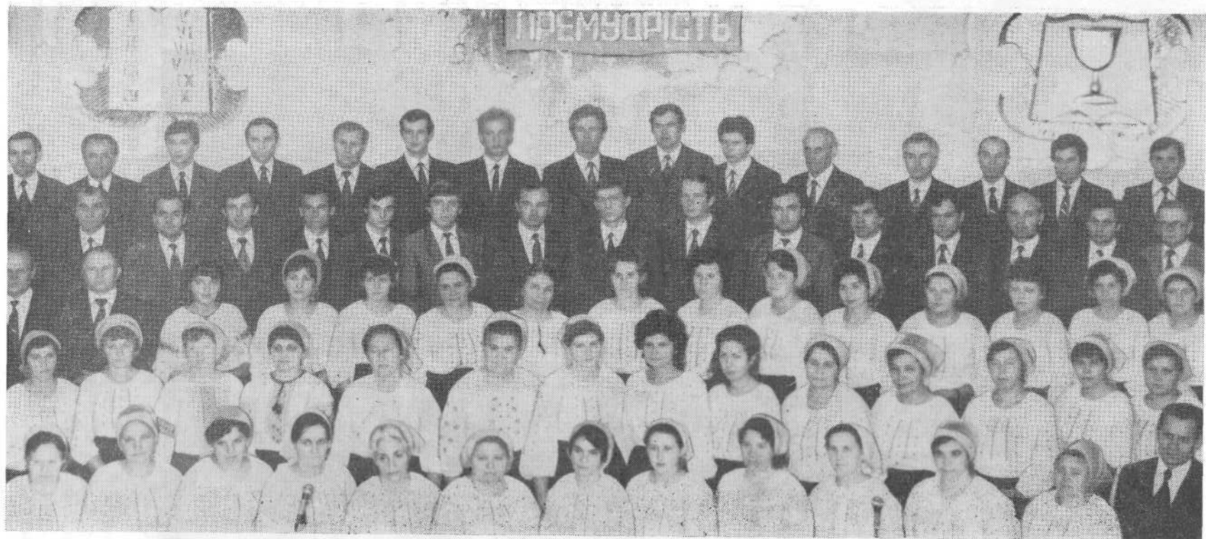
Хористы церкви в городе Львове.