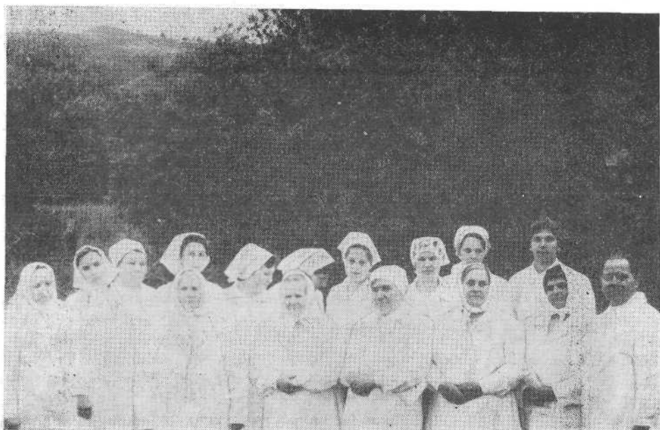
Крещаемые церкви города Красноярска.