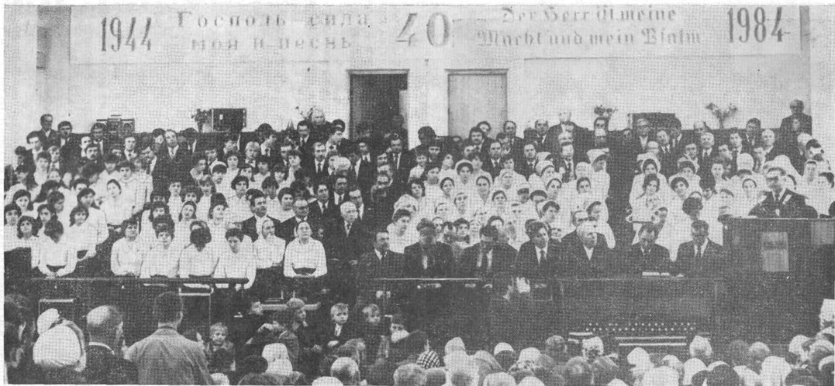
Богослужение в церкви города Алма-Аты.