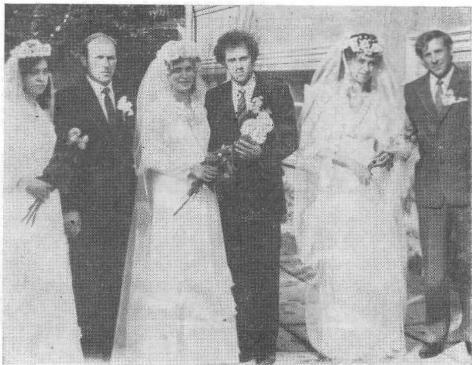
Брачущиеся пары церкви в городе Ростове-на-Дону.