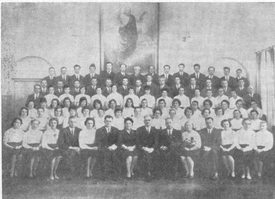
Хор Рижской Матвеевской общины