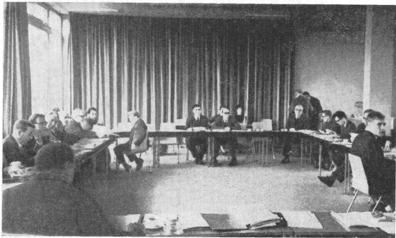
Заседание Рабочего Комитета Христианской Мирной Конференции