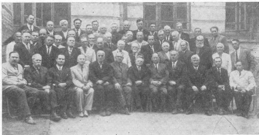
УЧАСТНИКИ СОВЕЩАНИЯ СЛУЖИТЕЛЕЙ УКРАИНСКОГО БРАТСТВА В КИЕВЕ 9—10 ИЮНЯ 1966 г.