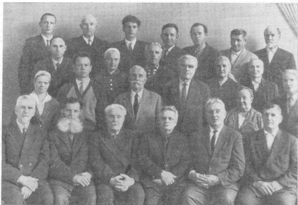
ЦЕРКОВНЫЙ СОВЕТ ТАШКЕНТСКОЙ ОБЩИНЫ