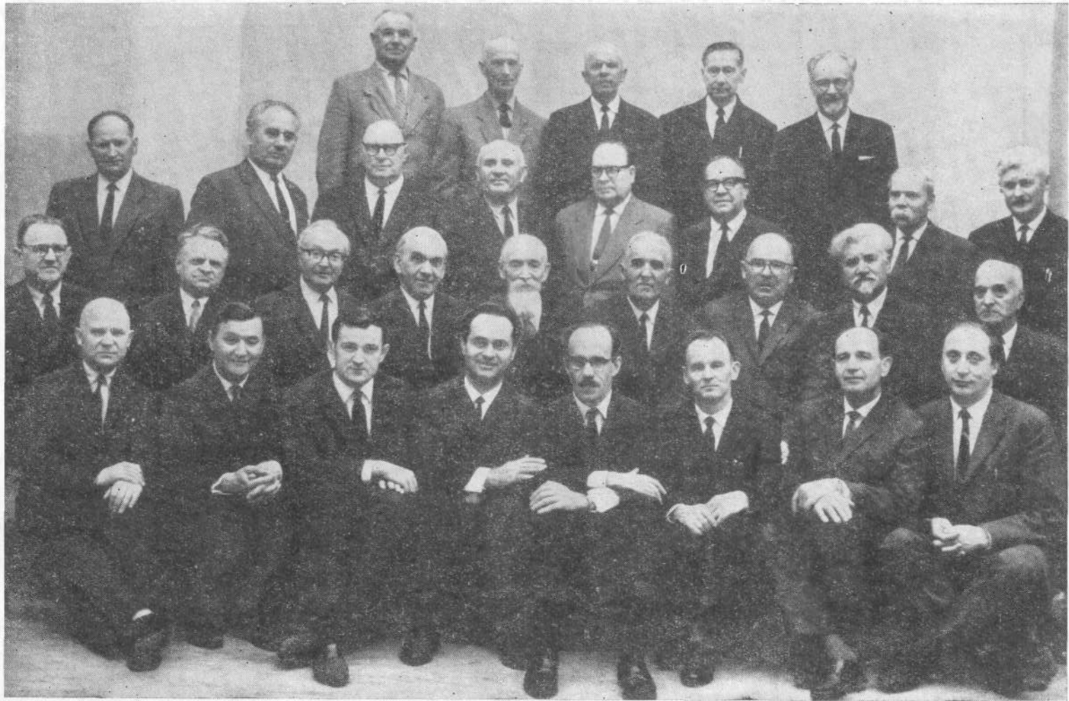
УЧАСТНИКИ ПЛЕНУМА ВСЕХЪ — 17/V — 1966 г.