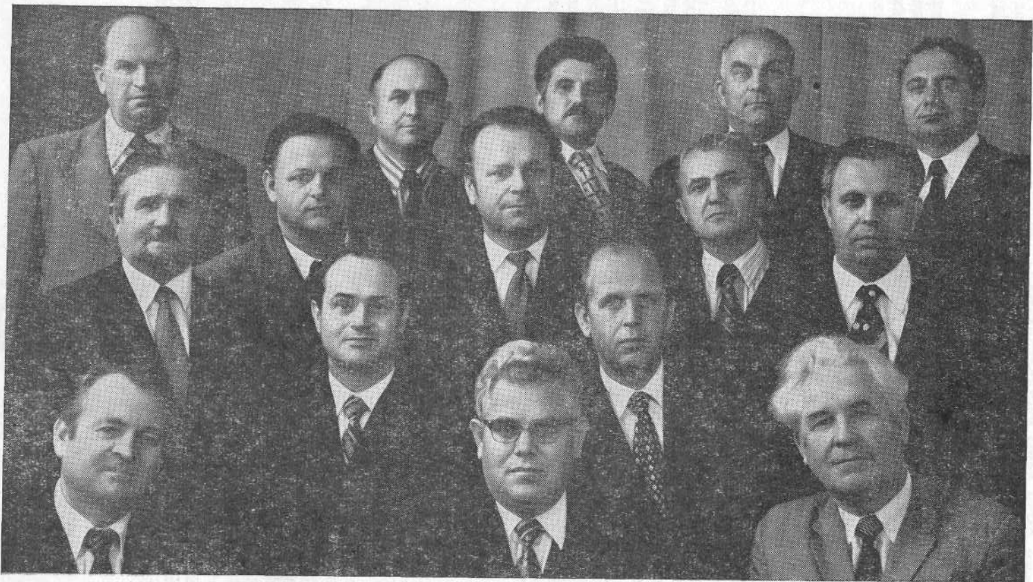
Члены пресвитерского совета при старшем пресвитере по Украине