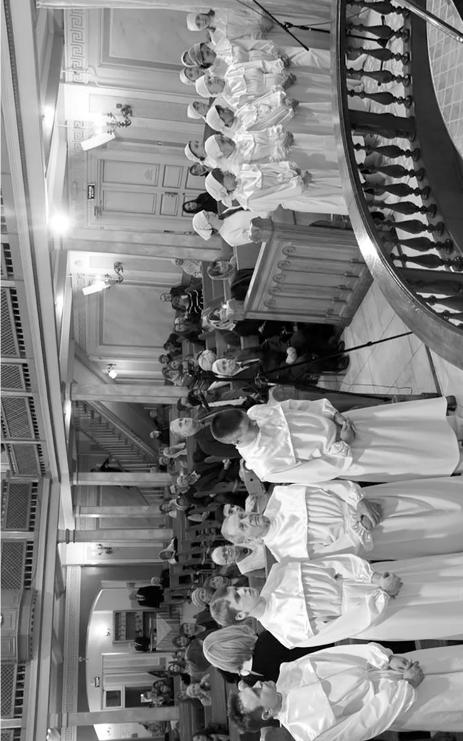
Крещаемые в Центральной Московской церкви