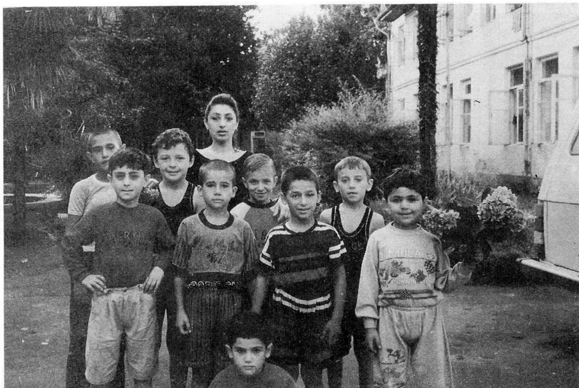
Один из отрядов христианского лагеря в Цихидзири, Грузия