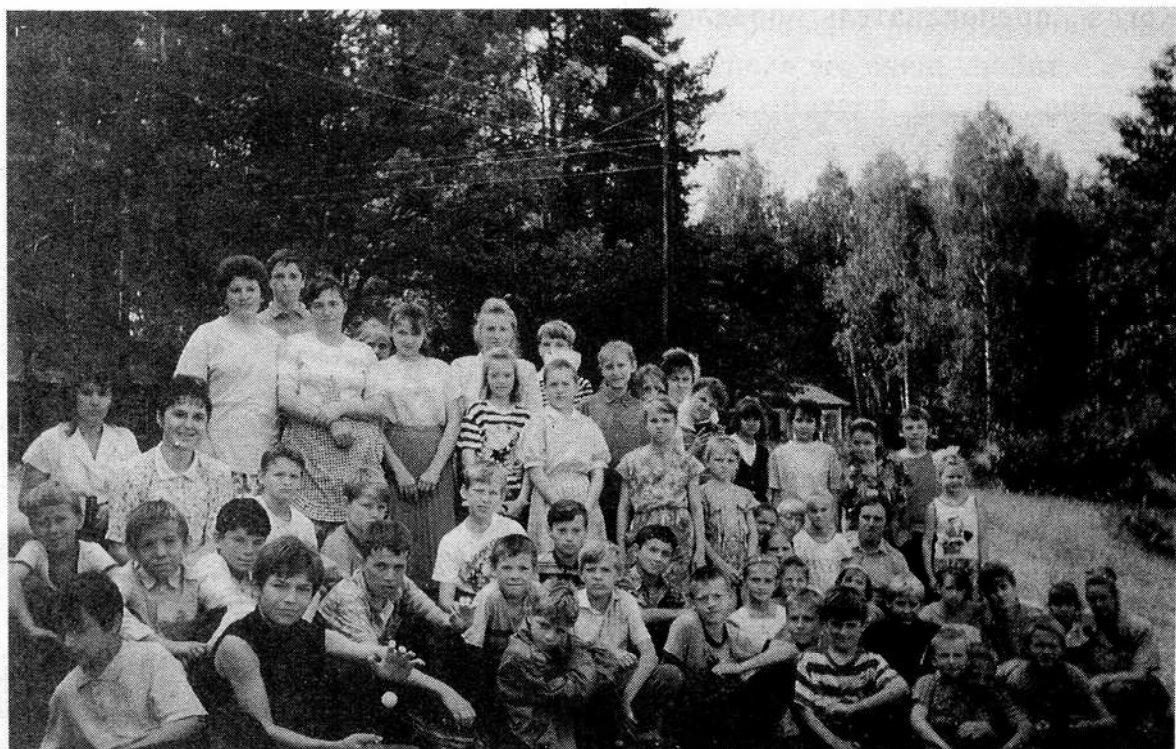
Участники детского христианского лагеря в Брянске