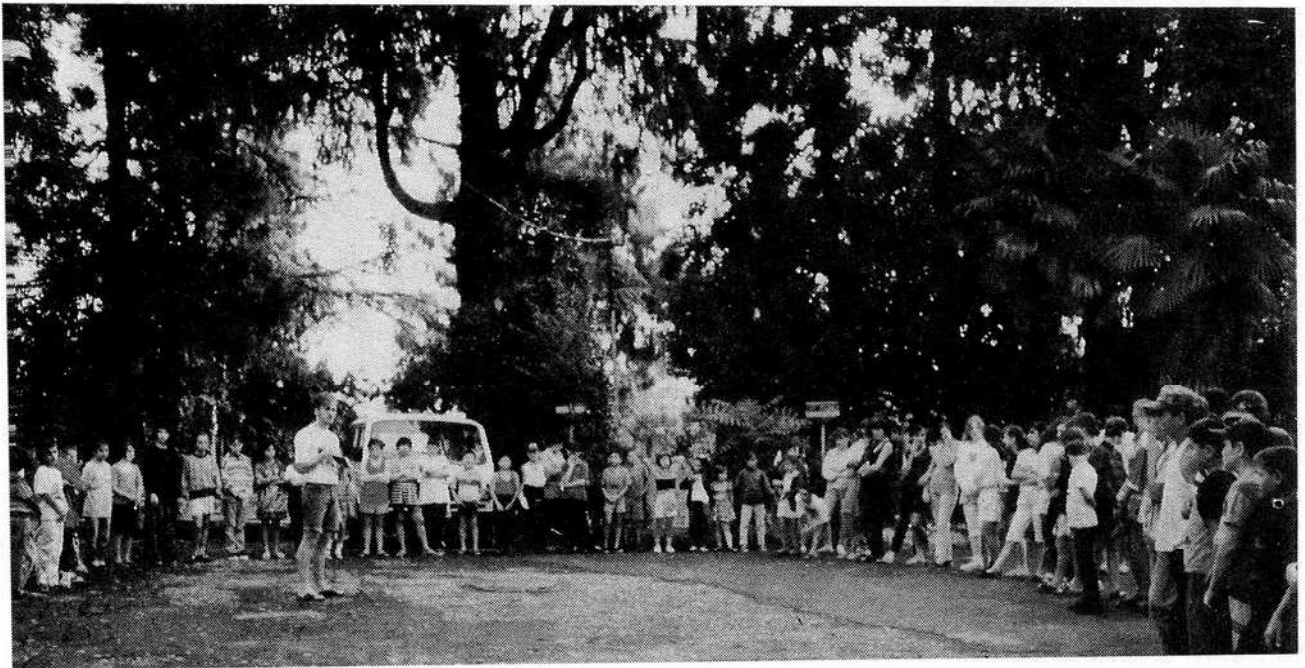
Перед молитвой в евангелизационном лагере в Цихидзири, Грузия