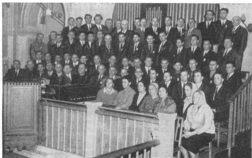
ХОР РЕГЕНТОВ НА СЪЕЗДЕ