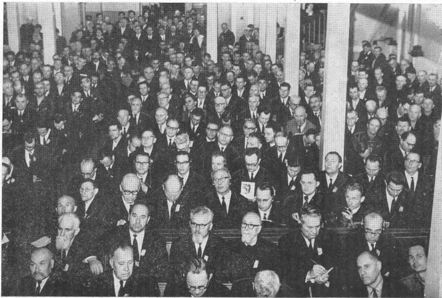
ВСЕСОЮЗНЫЙ СЪЕЗД ЕВАНГЕЛЬСКИХ ХРИСТИАН-БАПТИСТОВ 1966 ГОДА (Правая сторона зала)