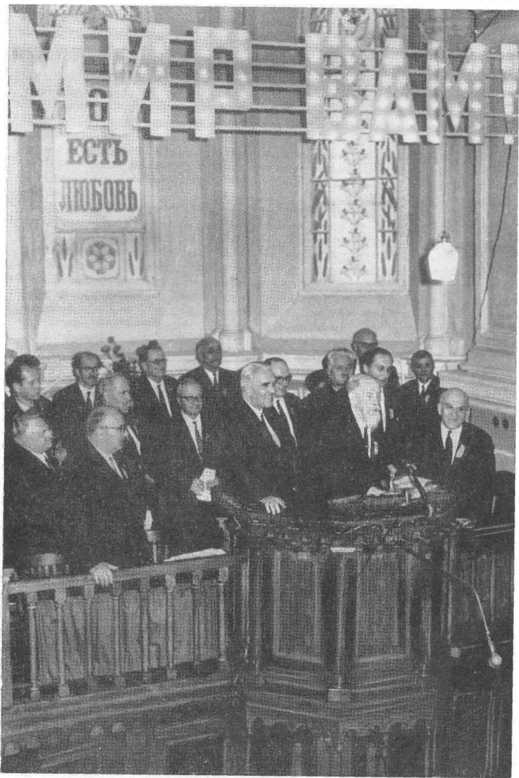
ПОСЛЕДНЕЕ ВЫСТУПЛЕНИЕ УШЕДШЕГО В ВЕЧНОСТЬ Я. И. ЖИДКОВА