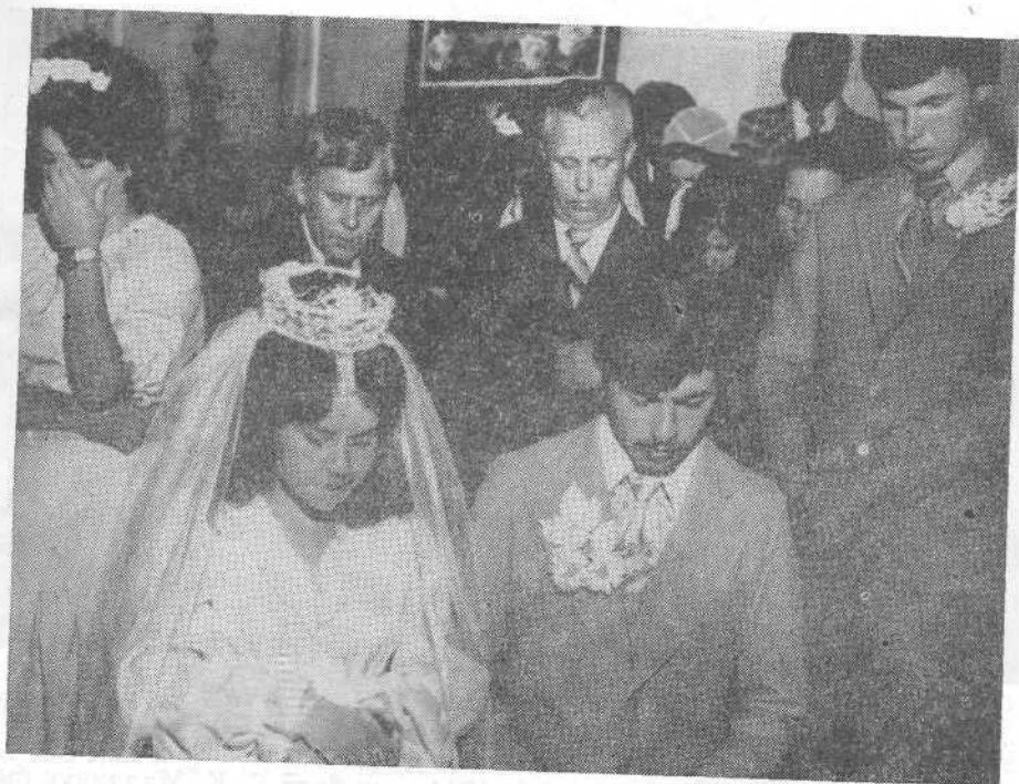
Бракосочетание в Хмельницкой церкви.