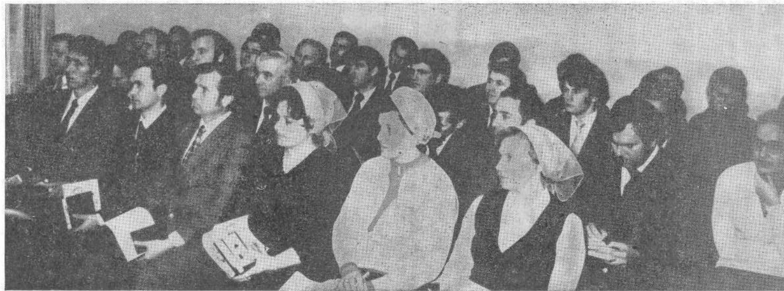
Выпускники регентской группы при заочных Библийских курсах ВСЕХБ.