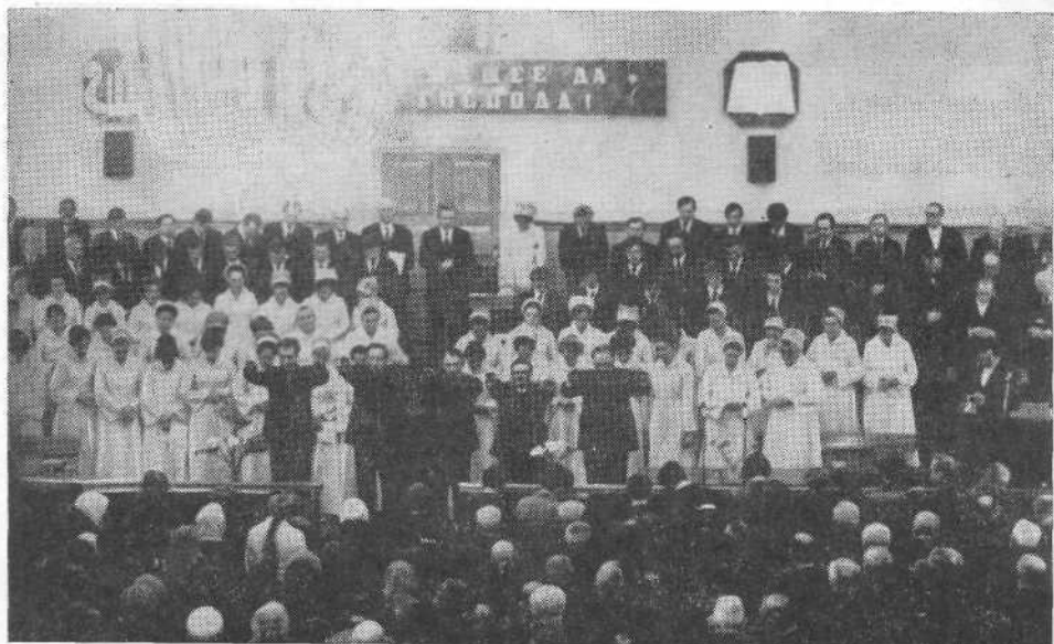
Освящение нового молитвенного дома в г. Джамбуле.