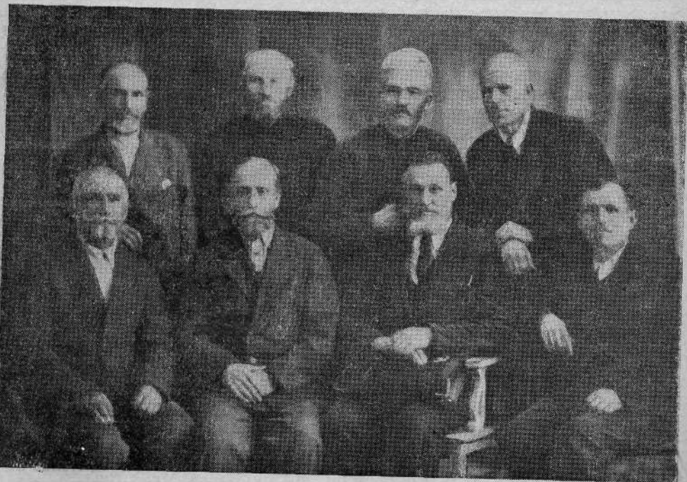
Группа работников Ташкентской общины евангельских христиан баптистов

В городе Коканде , одном из крупных центров хлопководства в Ферганской долине, которая с севера загорожена системой гор Тянь-Шаня, а с юга Алайским и Туркестанским хребтами, нашел я общину еван-