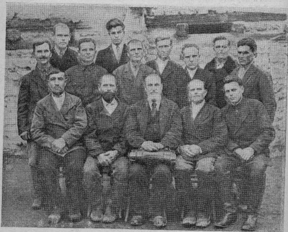
Группа работников Ферганской общины евангельских христиан-баптистов