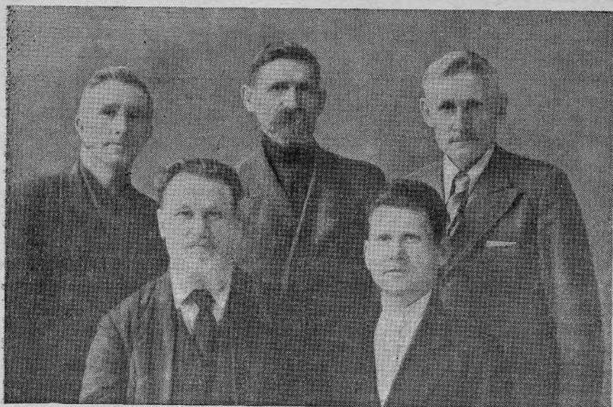
Группа рукоположенных работников Сталинабадской общины евангельских христиан-баптистов

В столицу Таджикистана — Сталинабад — путь ведет по дну бывшего моря. По обеим сторонам — высокие горы, вершины покрыты вечными снегами, страна величайших ледников. Большая часть населения сосре-