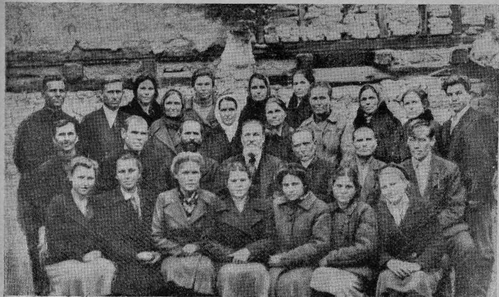
Хор Ферганской общины евангельских христиан-баптистов

гельских христиан-баптистов. Хотя община небольшая: членов 30 человек и хор в 15 человек, но благословения даются Господом не по численности собирающихся, что и на этот раз имело место.