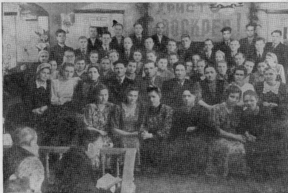
Хор Новосибирской общины евангельских христиан-баптистов