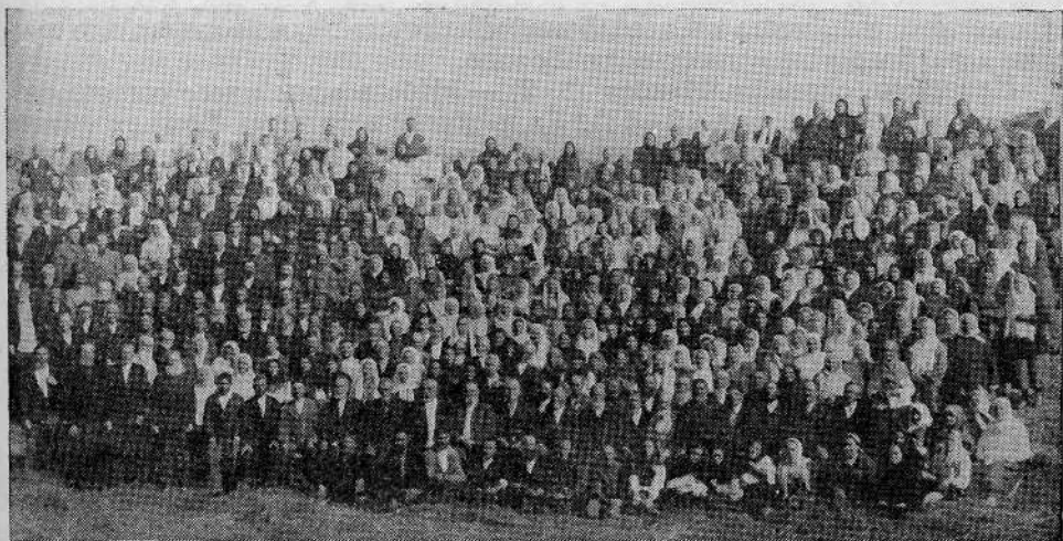
Бакинская община духовных христиан-молокан (150-летие молокан)