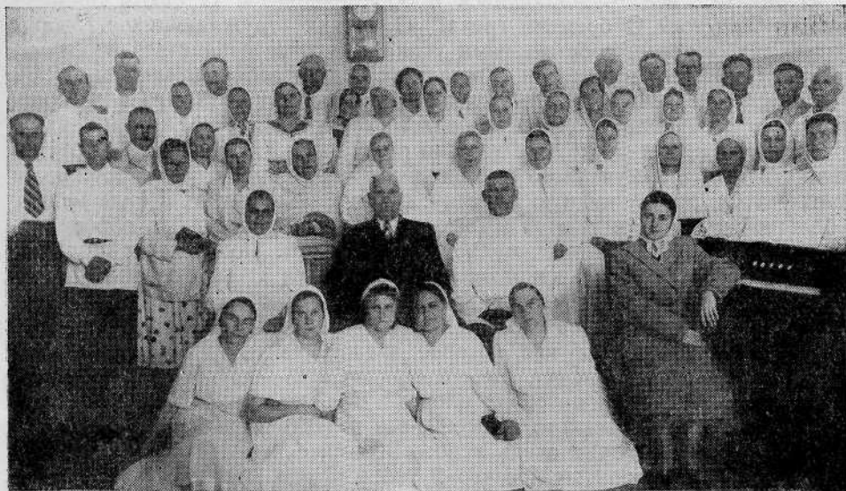
Хор Бакинской общины евангельских христиан-баптистов

Что лишает нас мира и покоя? Всякое иго, всякое бремя, всякий крест, который мы не хотим нести! Но как только мы сознаем, что наше иго — иго от Христа, нашего Спасителя, что это иго нам во благо, наше благо, что Христос нес Свое иго с кротостью и смирением, и, как только мы начинаем нести свое иго тоже с кротостью и смирением, в наших душах сейчас же водворяется мир и покой. Кротко и смиренно повторяет наше сердце слова: да будет воля Его!»