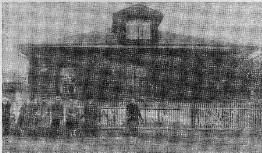
Молитвенный дом Горьковской общины