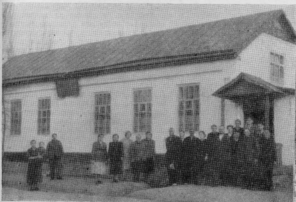
Молитвенный дом второй фрумзенской общины евангельских х и саиан-баптистов (Киргизская ССР)