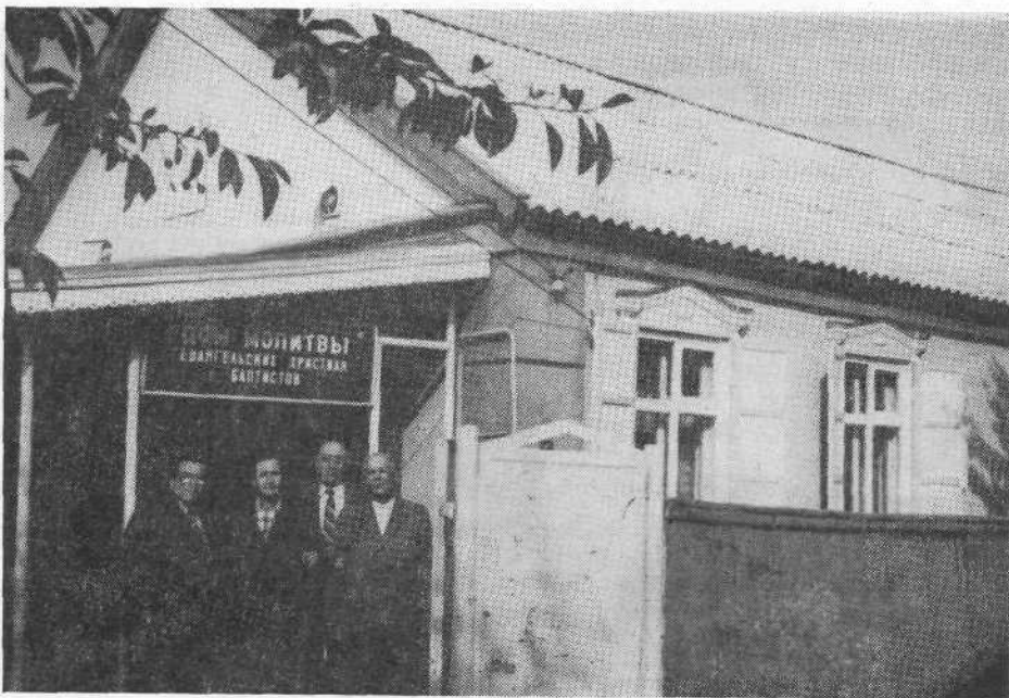
Молитвенный дом церкви г. Кропоткина Краснодарского края.

пода и Спасителя Иисуса Христа: «Хорошо, добрый и верный раб! в малом ты был верен, над многим тебя поставлю; войди в радость господина твоего» — Мф. 25, 21.