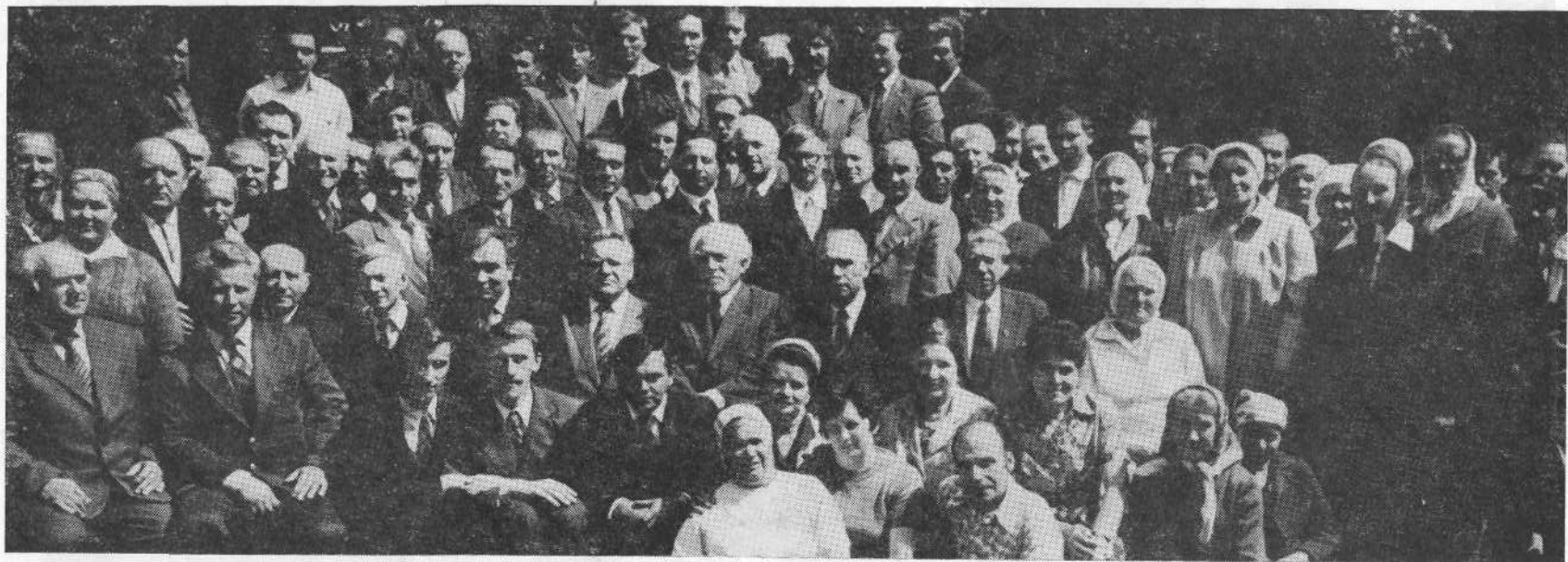
Участники семинара представителей церквей Горьковской области.