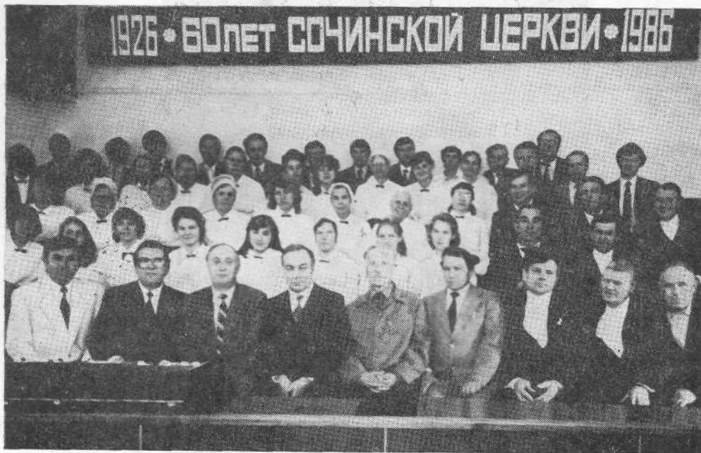
Представители ВСЕХБ среди хористов церкви г. Сочи.