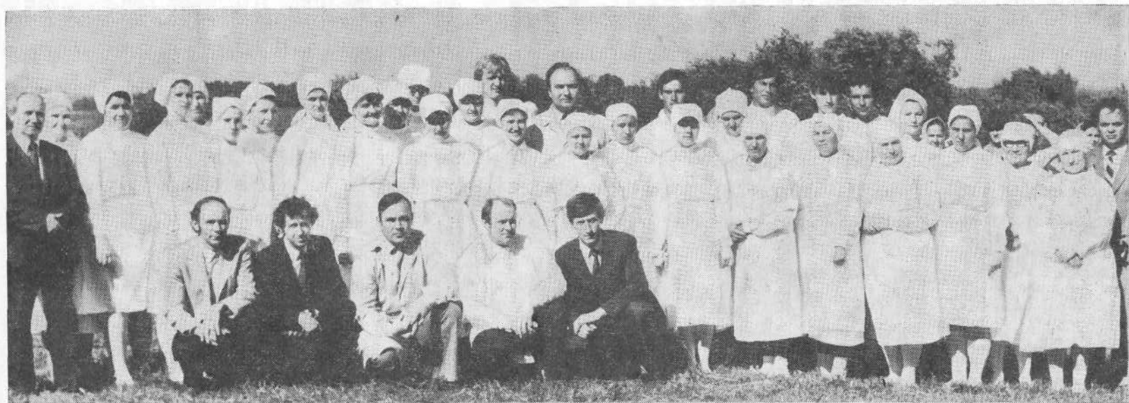
Крещаемые церкви г. Минска.