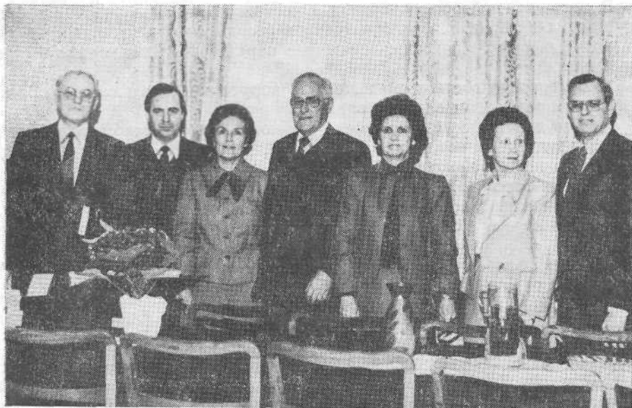
Руководители Южной баптистской конвенции США в канцелярии ВСЕХБ.

ранием сердца и изумлением следили за тем, как он ступает по воде. Когда же Петр взглянул на волны и ветер, его объял страх, и он начал тонуть. Но он вновь с верою воззвал: «Господи! спаси меня». И Христос простер руку, поддержал его и сказал с мягким упреком и сожалением: «Малoverный! зачем ты усомнился?»