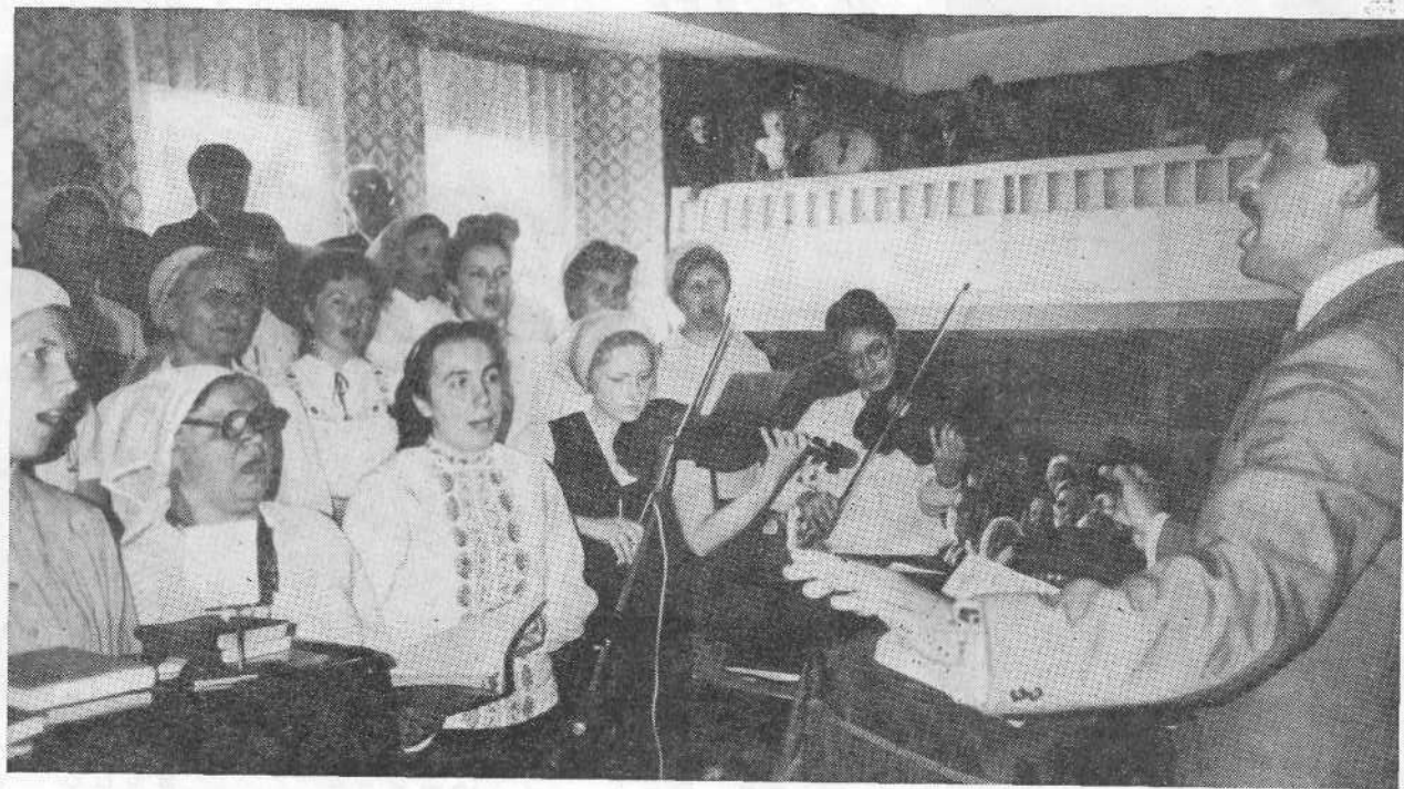
Богослужение в церкви г. Горького.