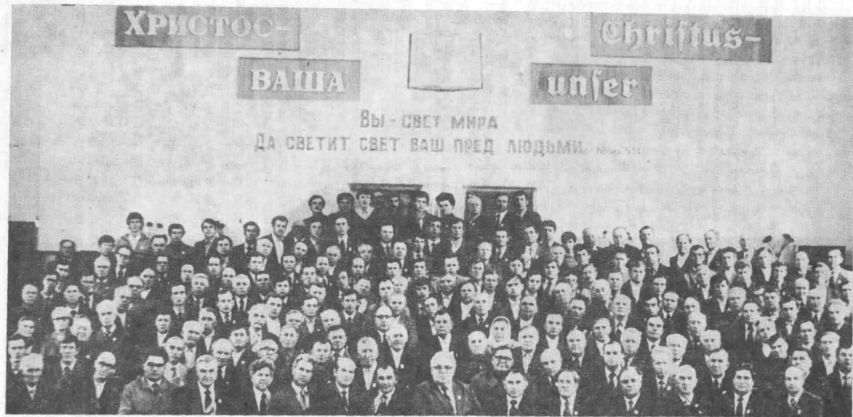
Участники совещания служителей церквей Казахстана.