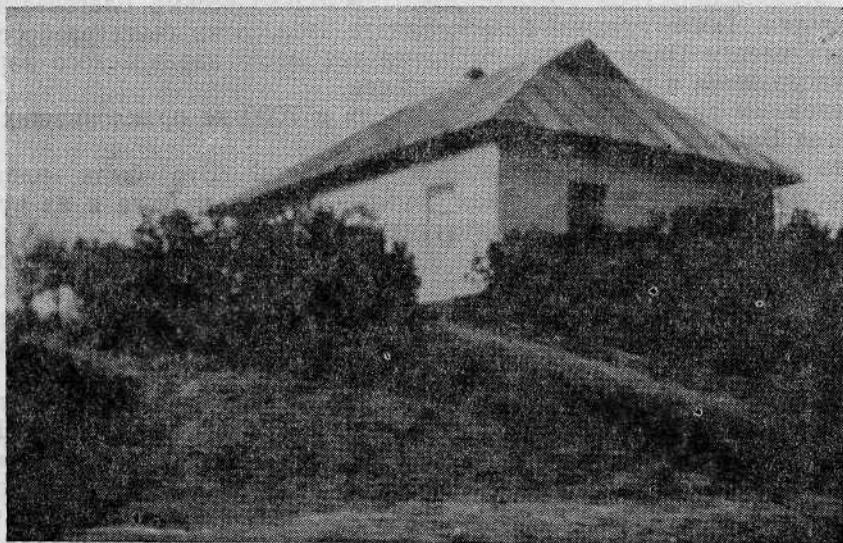
Молитвенный дом евангельских христиан-баптистов в селе Буденовка (Тетиевский район, Киевской области)