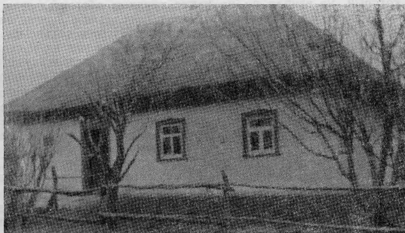
Молитвенный дом Карапышинской общины евангельских христиан-баптистов (Старчинский район, Киевской области)