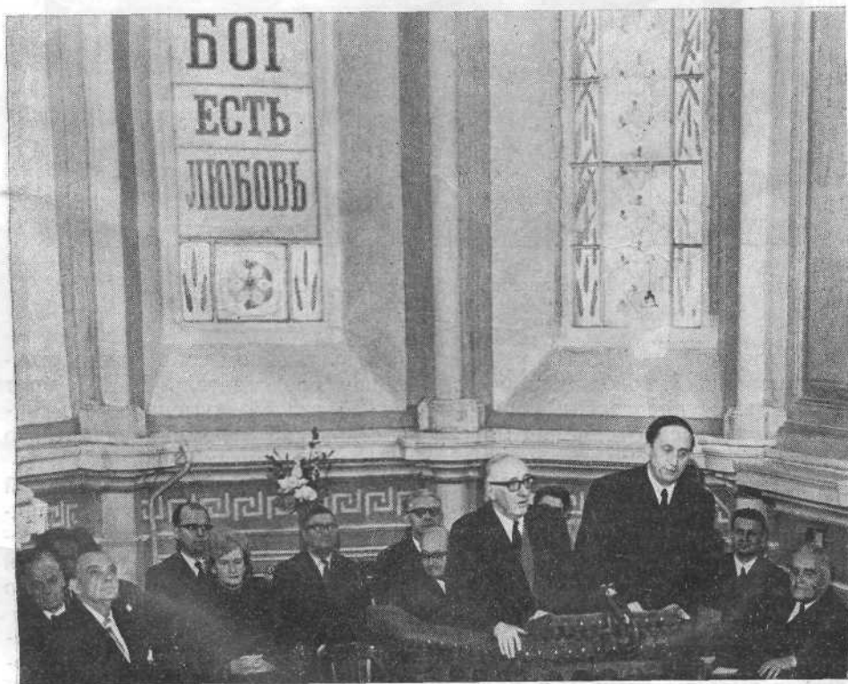
Выступает президент ВСЦ д-р Э. Пейн

В воскресенье 6 февраля 1972 г. Всесоюзный Совет евангельских христиан-баптистов и Московскую церковь посетила делегация Всемирного Совета Церквей, которую составили: д-р Ю. Блейк — генеральный секретарь, д-р Э. Пейн — президент, д-р В. Хуфт — почетный президент, д-р Р. Николс — епископ методистской церкви, мисс П. Вебб — зам. председателя исполкома ВСЦ и другие.