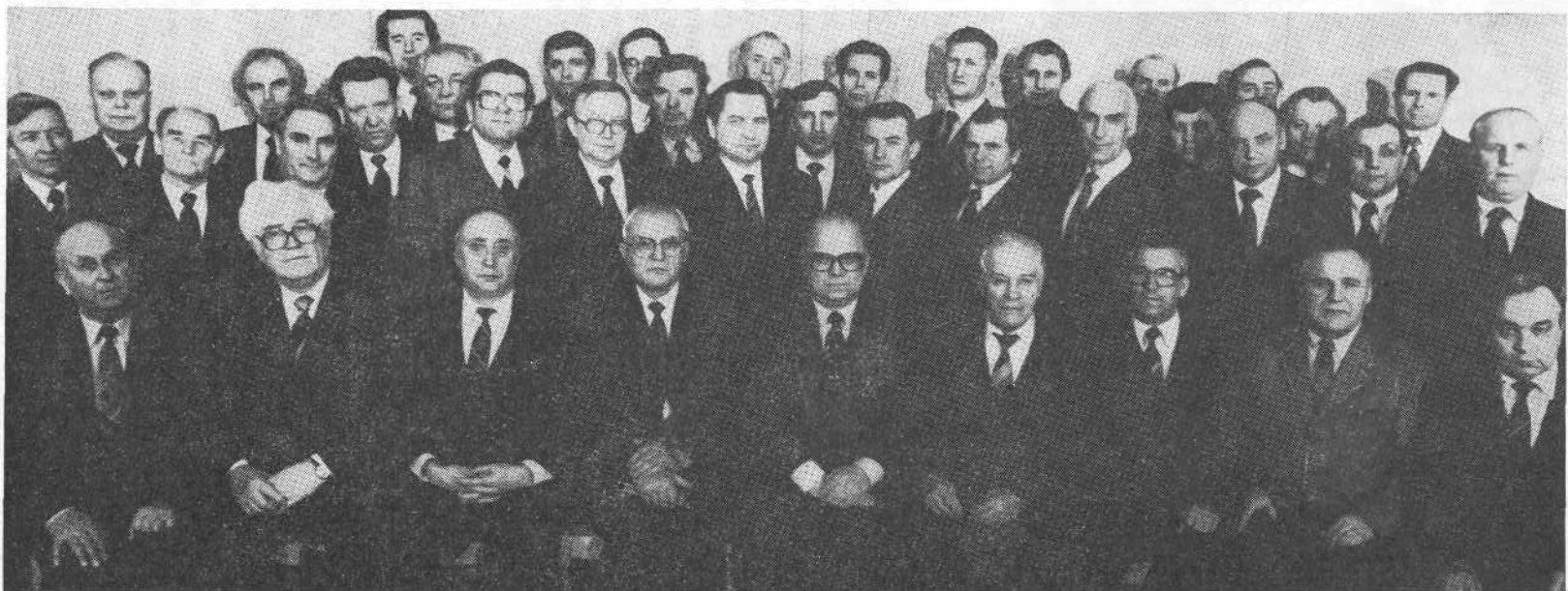
Участники семинара Российской Федерации.