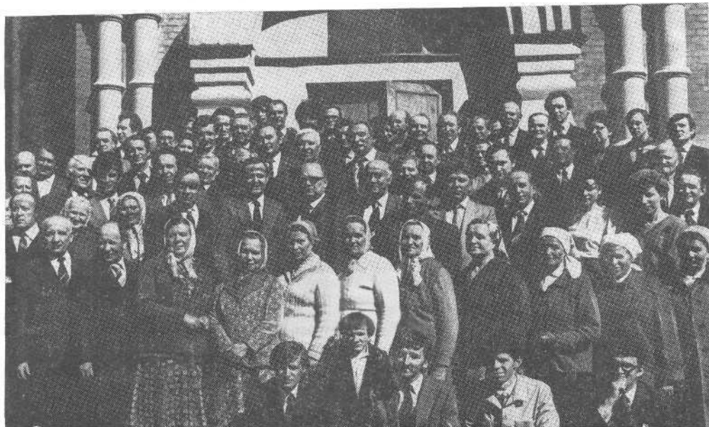
Участники совещания представителей церквей северо-западных областей.

дела в Ленинградской церкви, а молодые хористы вручили им цветы.