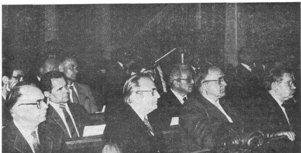
Участники Пленума ВСЕХБ в зале заседаний.

Члены Президиума проводят беседы с приезжающими в центр служителями по различным вопросам, которые требуют немедленного разрешения. Часто приходится помогать служителям по вопросам хозяйств о постройке, реконструкции и регистрации молитвенных домов.