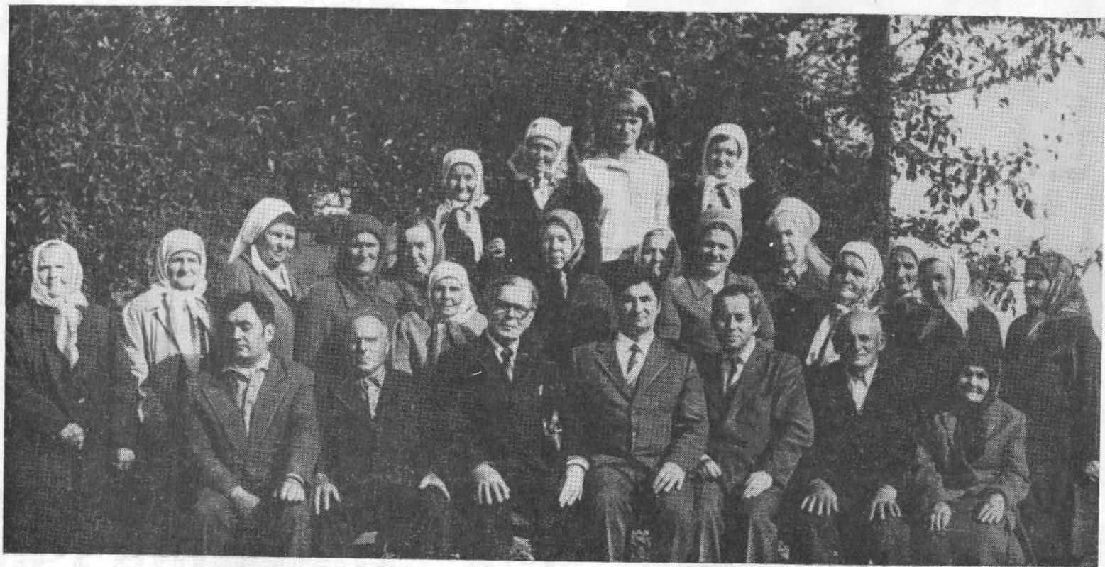
Верующие церкви с. Шелючи Запорожской области,