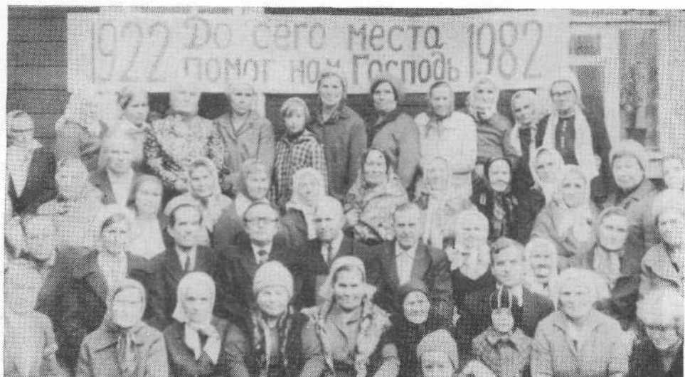
Верующие Осташковской церкви в день 60-летия церкви.

будет этот дом молитвы, — сказал в заключение брат, — местом поклонения живому Богу и утешения многим людям».