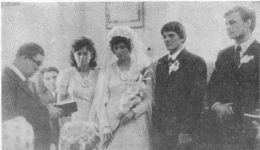
Бракосочетание в Моршанской церкви.