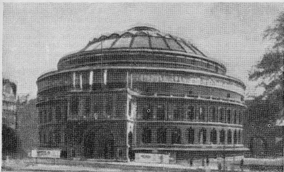
Альберт Холл в Лондоне в котором происходили заседания Всемирного Юбилейного Конгресса баптистов

В этот же день мы побывали в Советском Посольстве, где попрощались с сотрудниками Посольства.