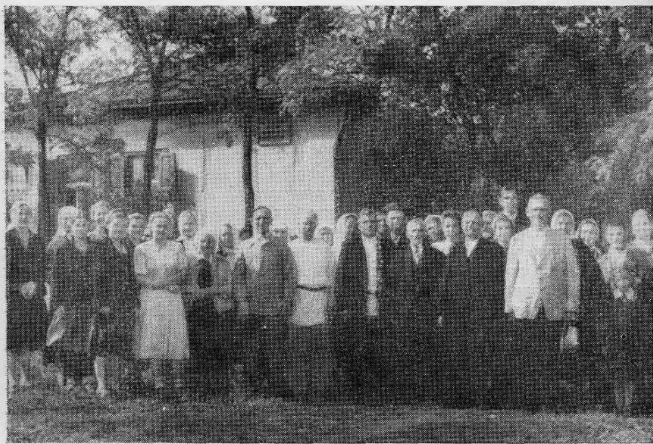
Молитвенный дом Армавирской общины (Краснодарский край)