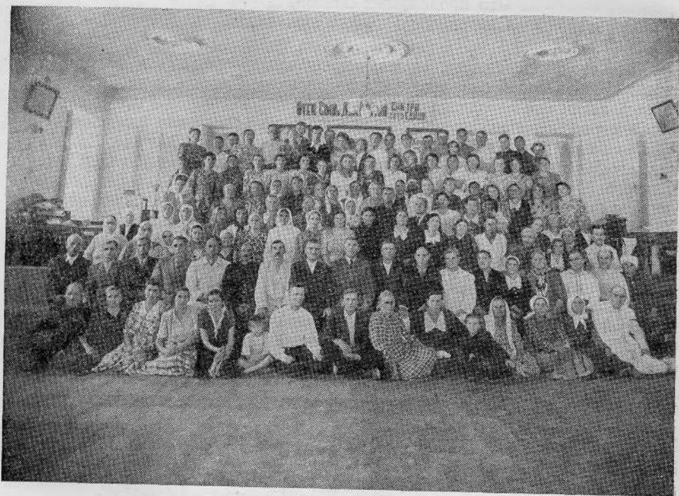
Часть Николаевской общины в молитвенном доме (Украина)