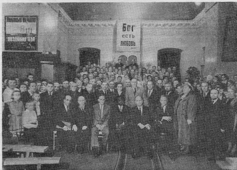
Американские гости в Ленинградской общине евангельских христиан-баптистов