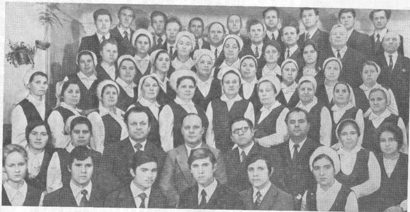
Хористы Ростовской церкви.