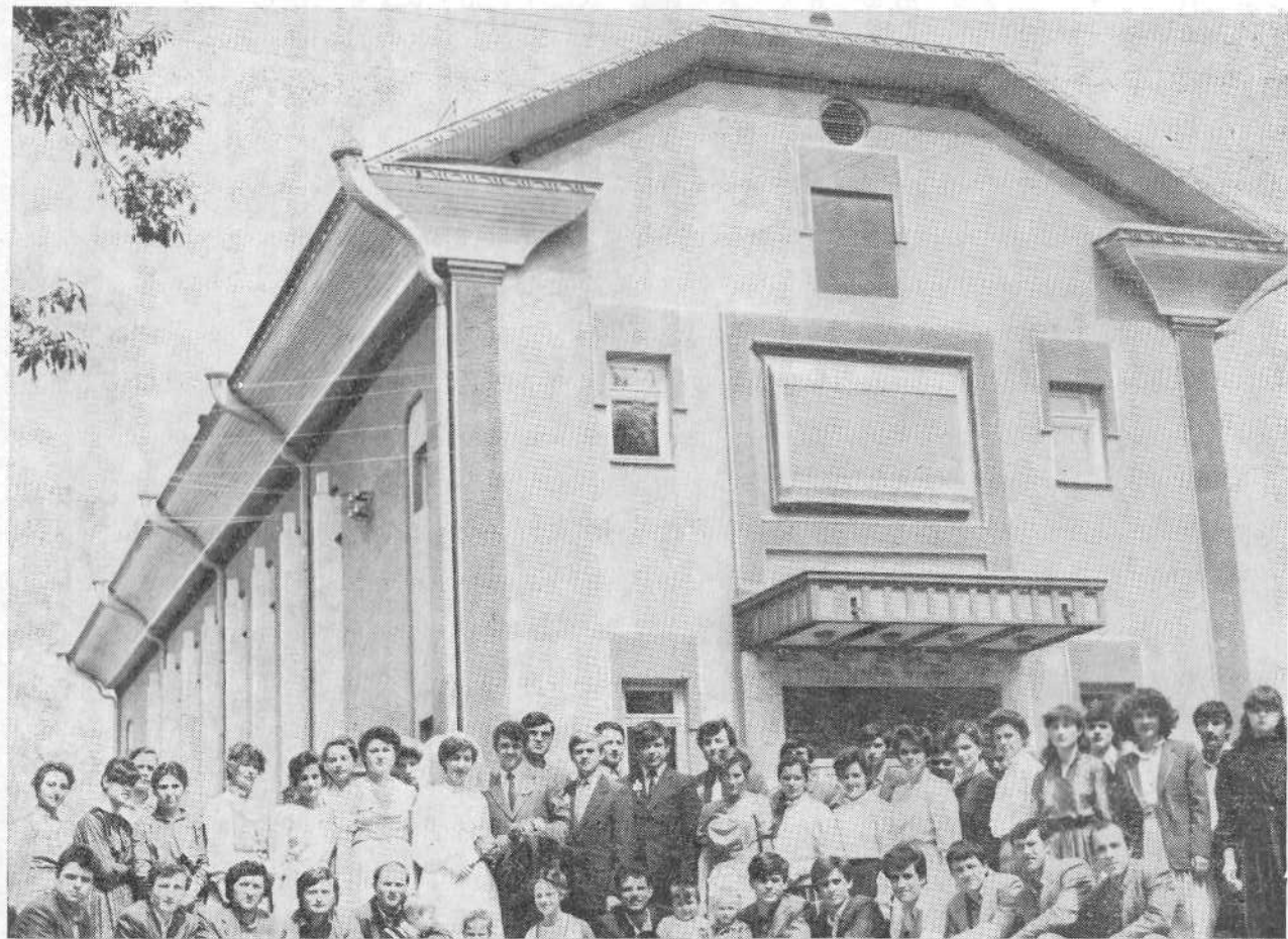
Верующие церкви города Бельцы (Молдавия).