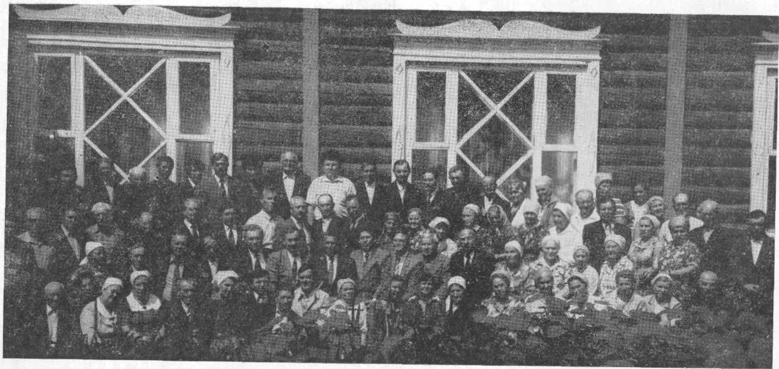
Участники семинара представителей церквей Дальнего Востока.