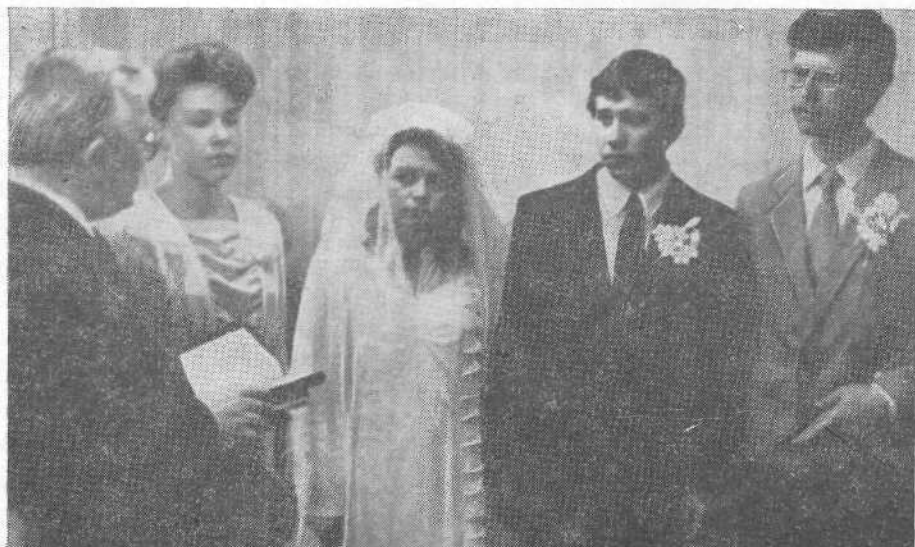
Бракосочетание в церкви города Кимры.