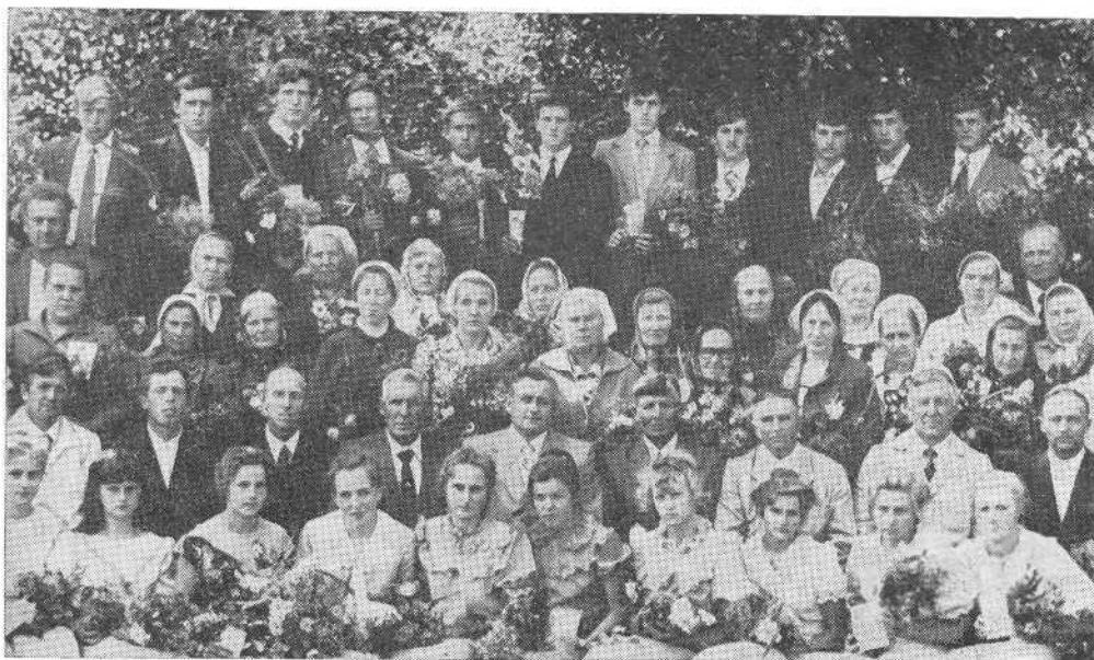
После крещения новых членов церкви поселка Донское Оренбургской области.