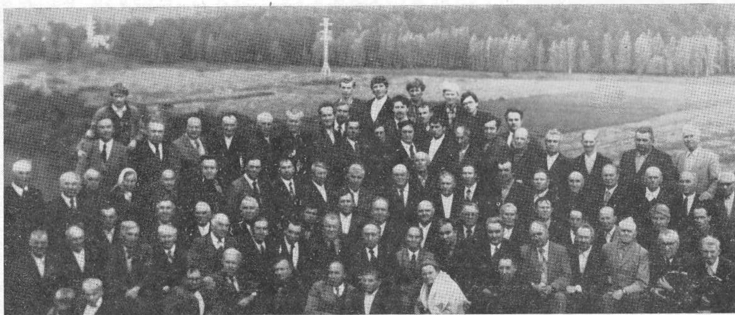
Участники семинара представителей церквей Западной Сибири.