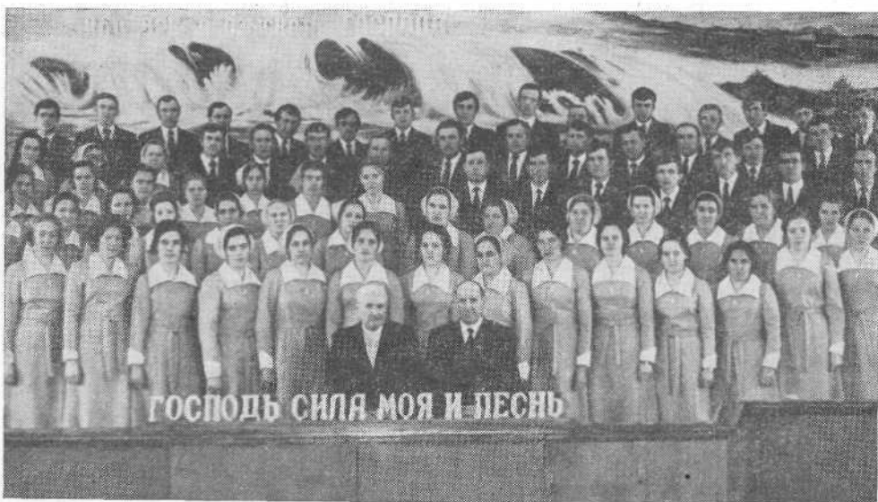
Хористы церкви поселка Сузаново Оренбургской области.

г. Курган-Тюбе. 25 мая 1986 года Курган-Тюбинская церковь отметила сороколетие со времени основания.