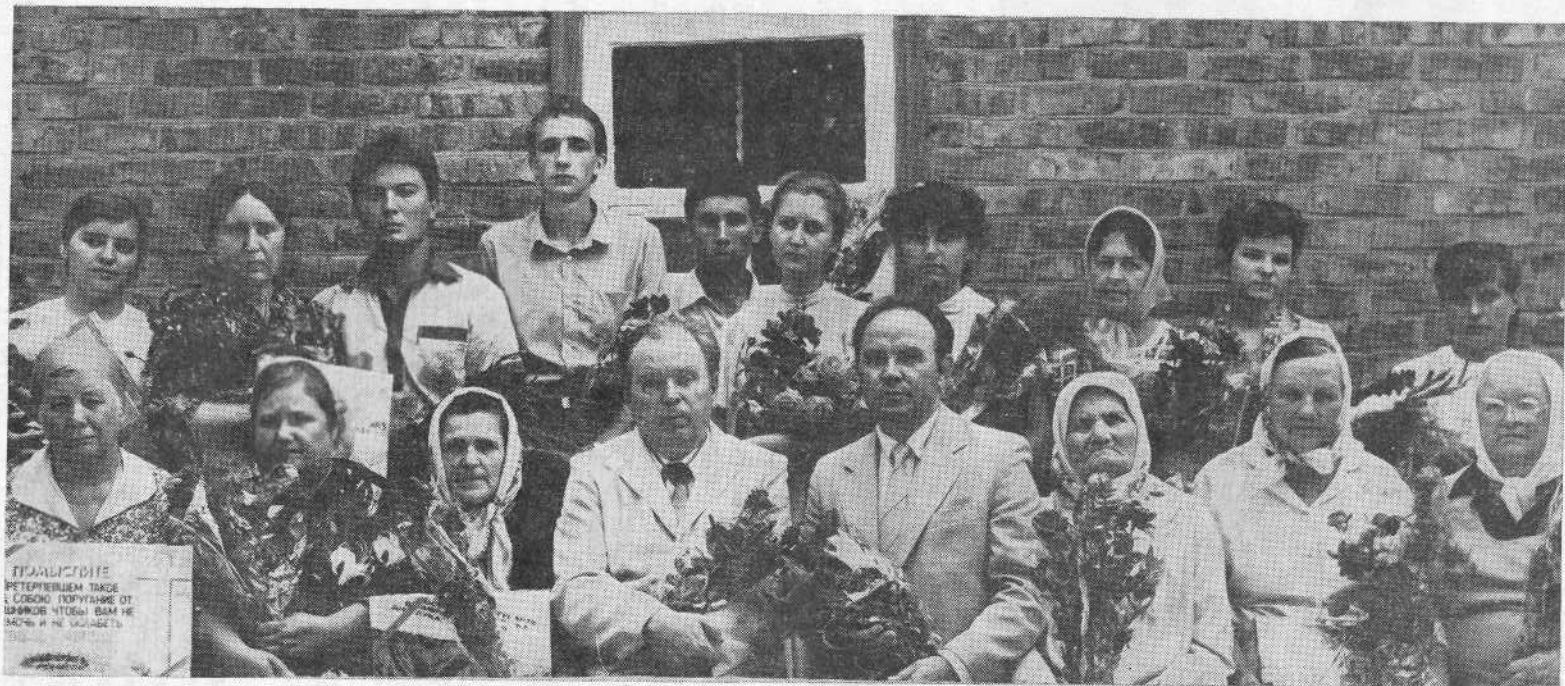
После крещения новых членов церкви города Черкассы.