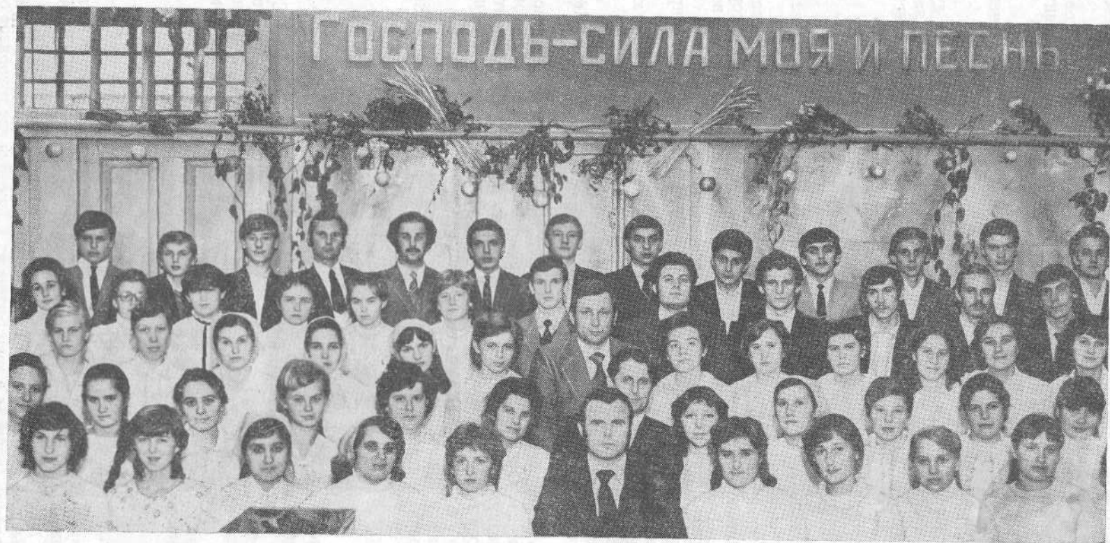
Хор церкви города Харькова.