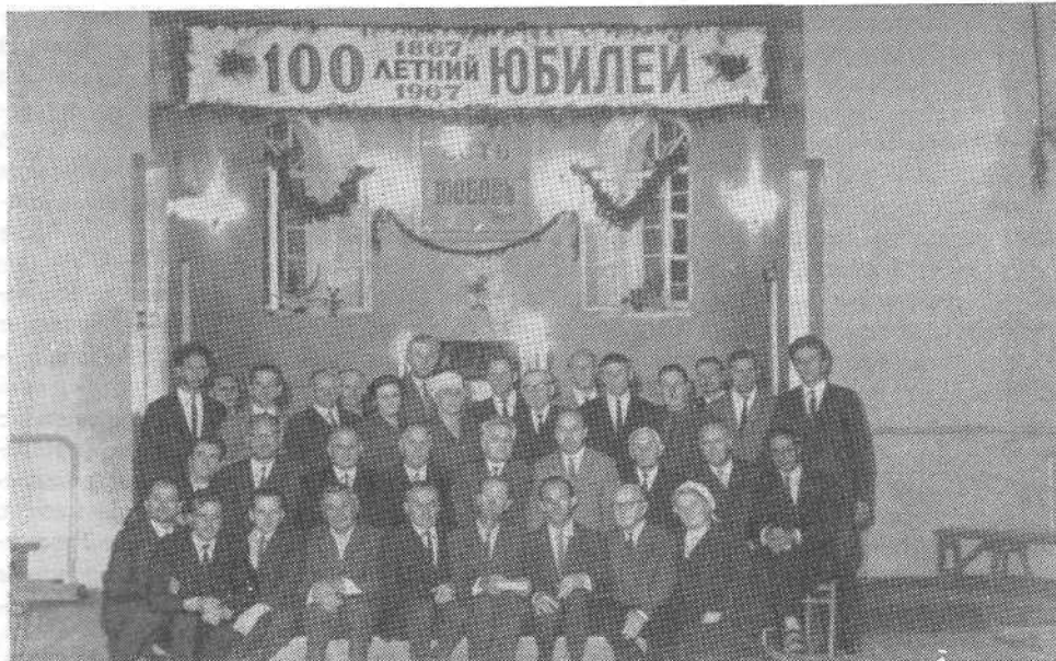
Служители Ленинградской церкви и гости из Латвии во время юбилейных торжеств.