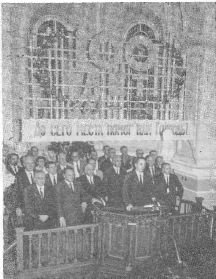
Юбилейное богослужение в Московской церкви.

Рабочий Комитет приветствует усилия Совета Безопасности и Генерального Секретаря ООН У Тана, способствовавшие прекращению