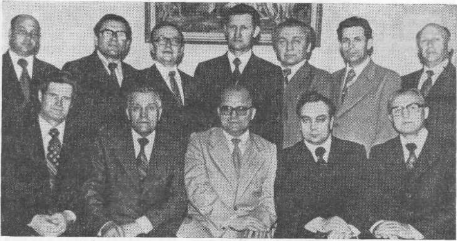
Пресвитерский совет по РСФСР и члены Президиума ВСЕХБ.