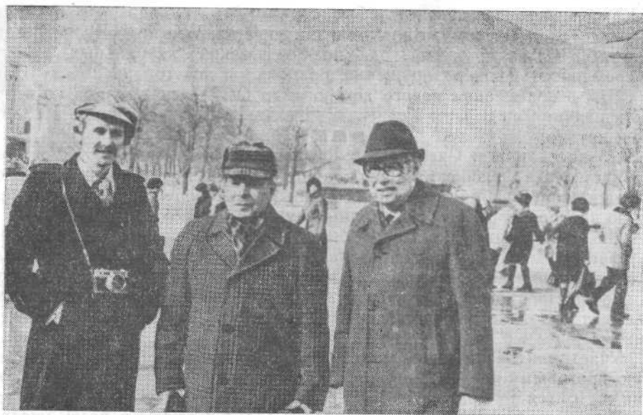
Гости из Швеции в Москве.