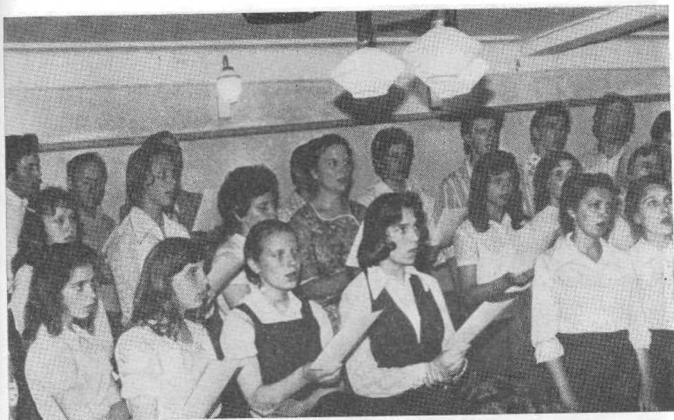
Хор Курской церкви.