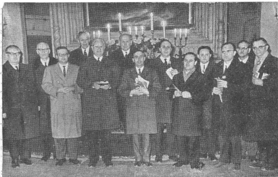
Американские и канадские братья в церкви Олевисте гор, Таллина

В воскресенье 29 марта гости участвовали в богослужении Минской церкви.