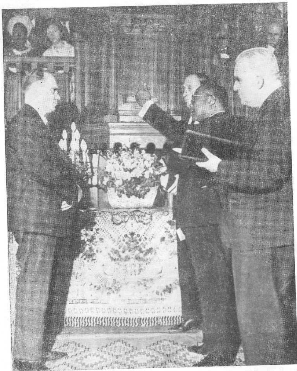
Президент У. Толберт дает духовные наставления брату А. М. Бычкову перед его рукоположением