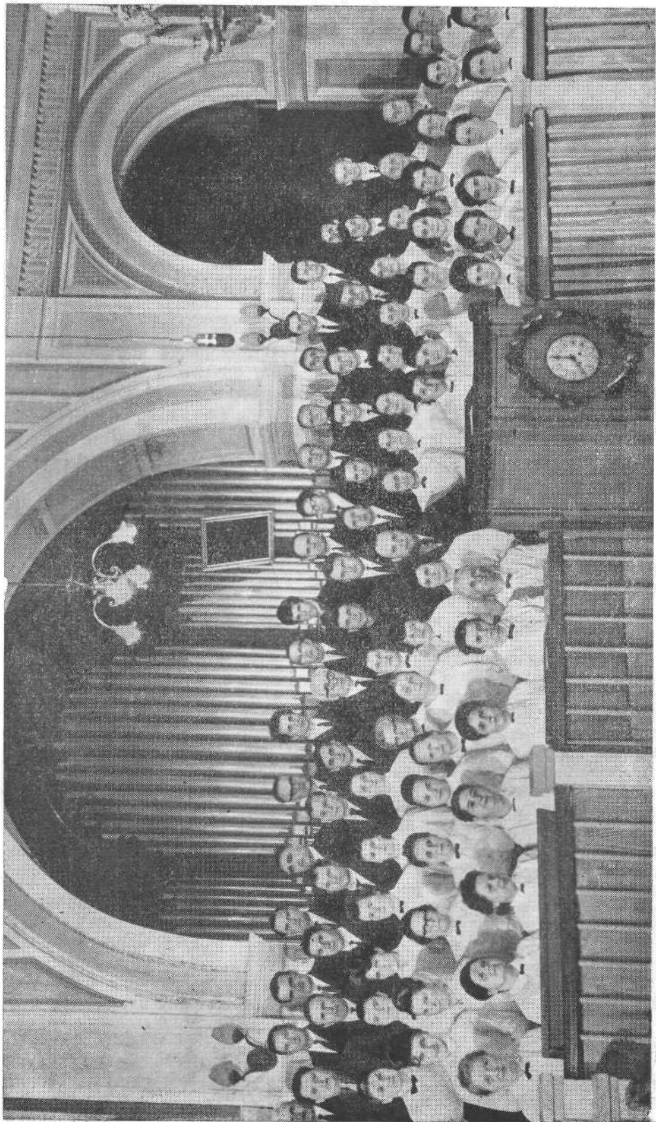
Хор Московской церкви