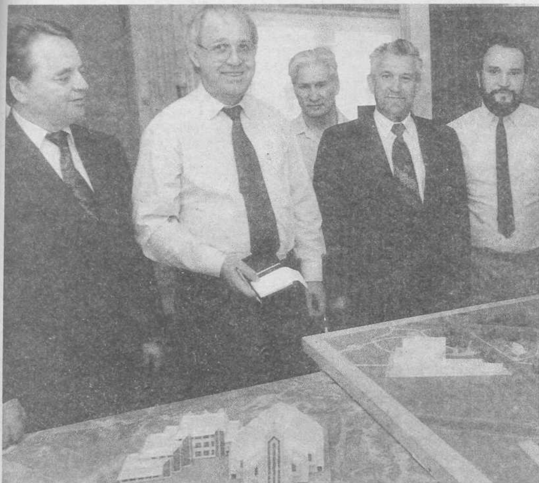
Генеральный секретарь Европейской баптистской федерации К. Х. Вальтер знакомится с проектом строительства дома молитвы церкви в Лосинке (Москва).

П. Д. Савченко. Он прочитал из Деян. 8, 26—39, где говорится о крещении эфиоплянина диаконом Иерусалимской церкви Филиппом.