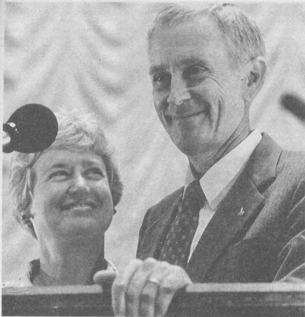
Чарльз Дьюк вместе со своей супругой свидетельствует о любви Христовой.