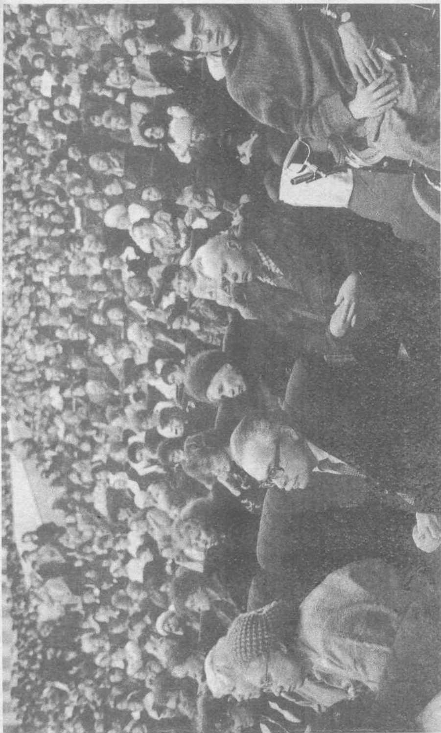
Евангелизационное собрание в Москве, проводимое миссией «Возрождение».