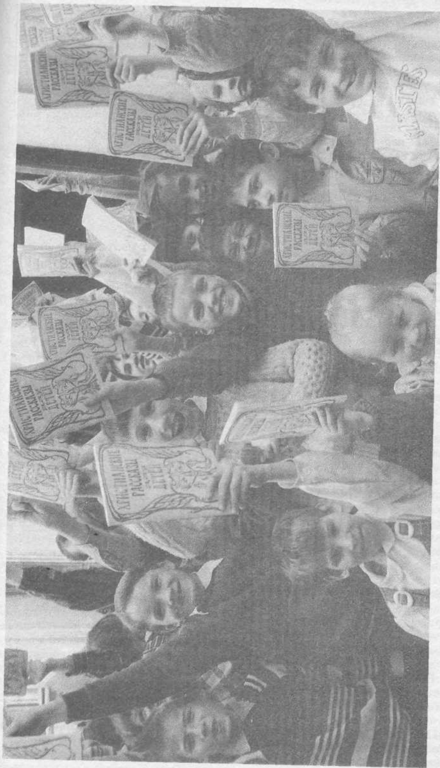
Дети школы-интерната после посещения Московской церкви.