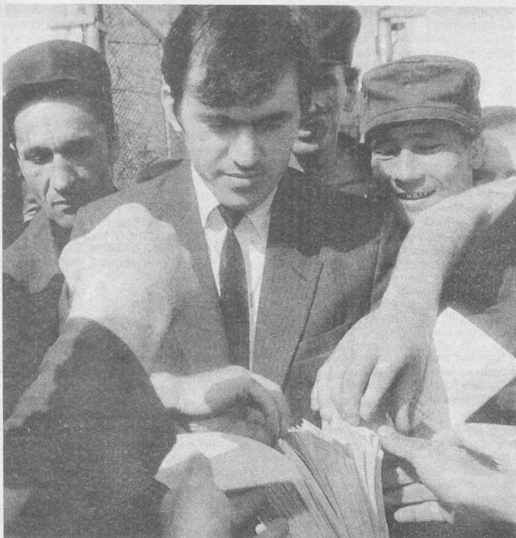
Раздача духовной литературы в мужской колонии г. Сургута.

выступали музыкально-певческие ансамбли из Санкт-Петербурга и Москвы.