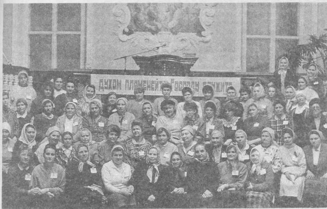
Участницы женской конференции Брянской области.

ко Мне, все труждающиеся и обремененные, и Я успокою вас» — Мф. 11, 28. Но немногие слышат этот призыв.