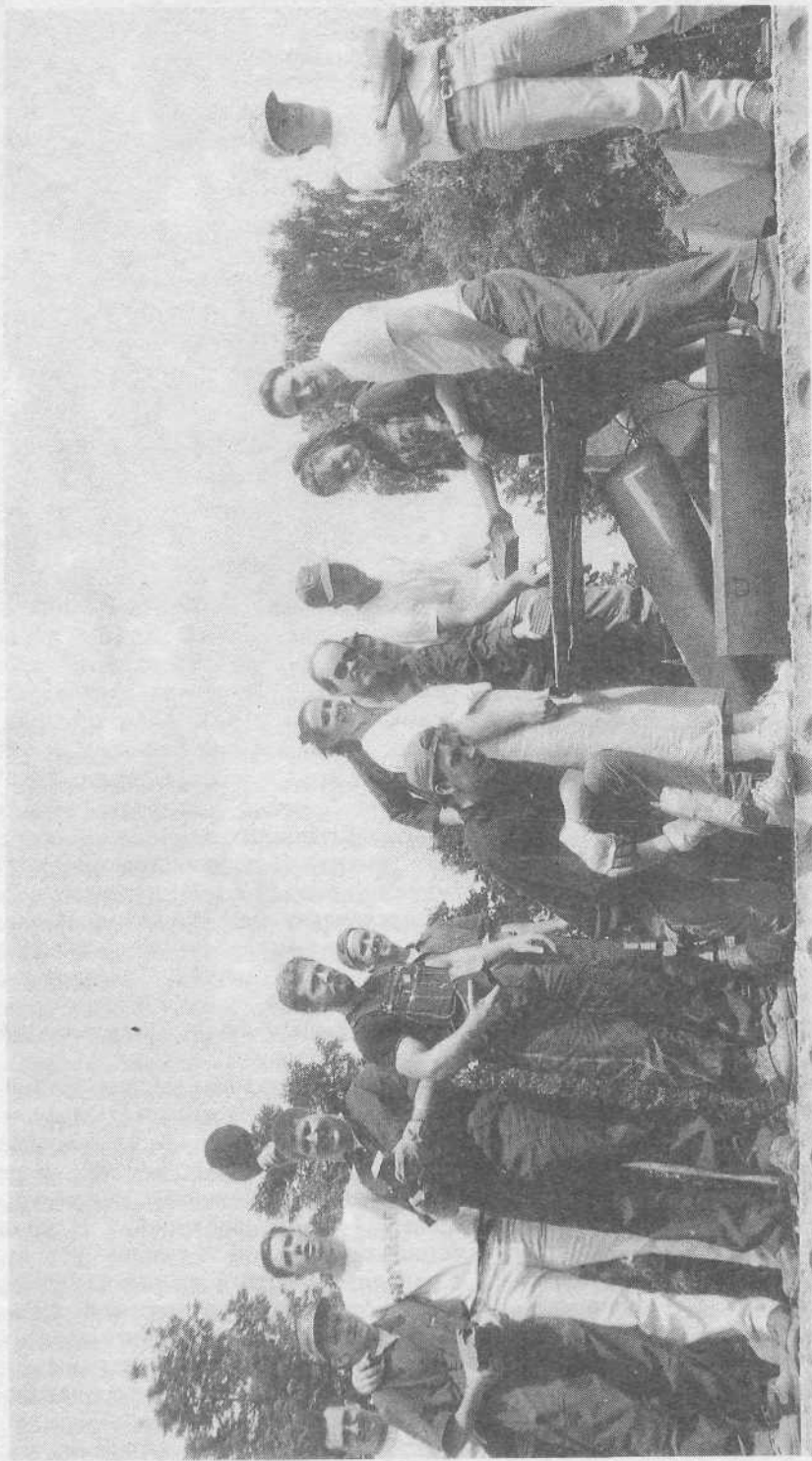
Группа верующих из Соединенных Штатов помогает в строительстве молитвенного дома в Мытищах Московской области.