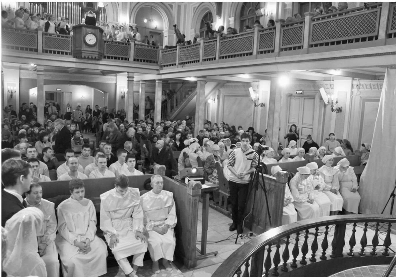
Крещаемые в Центральной Московской церкви