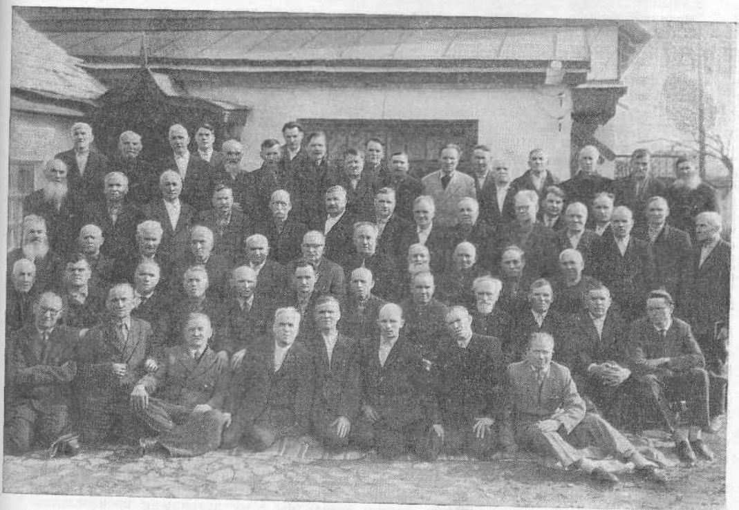
Совещание пресвитеров и других служителей церкви ЕХБ Черкасской области