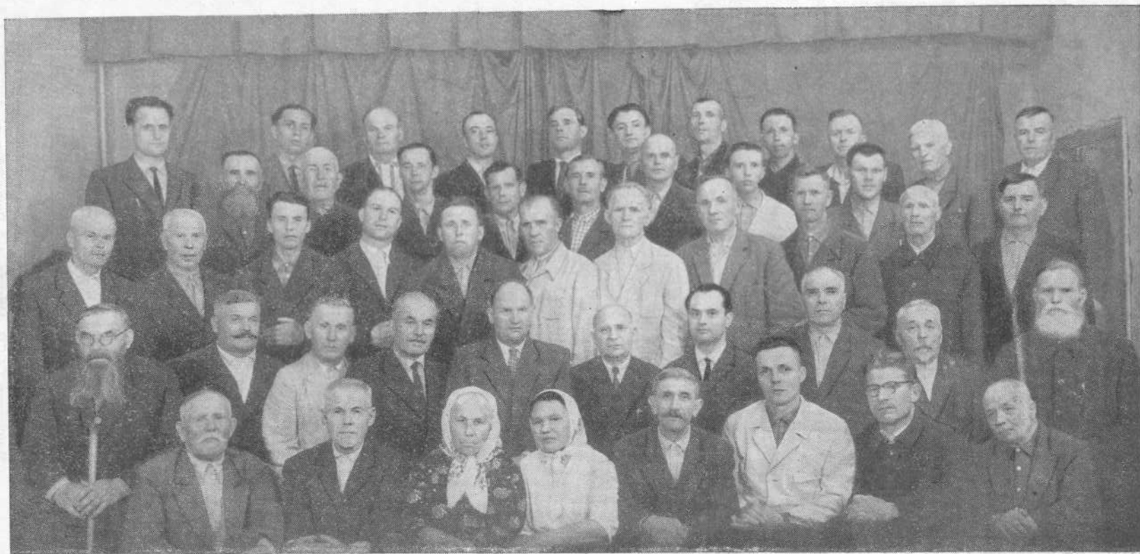
Совещание пресвитеров общин ЕХБ в Луганской области.